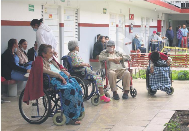
PROYECTO. "Jalisco te reconoce" tiene una bolsa de 157.5 millones de pesos para beneficiar a 29 mil 320 personas vulnerables

¿Qué opina de los apoyos que reciben las personas mayores de 60 años?