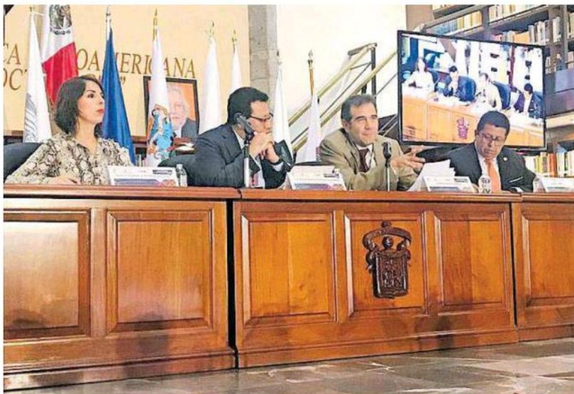
El titular del INE acudió al seminario "Construyendo Ciudadanía".