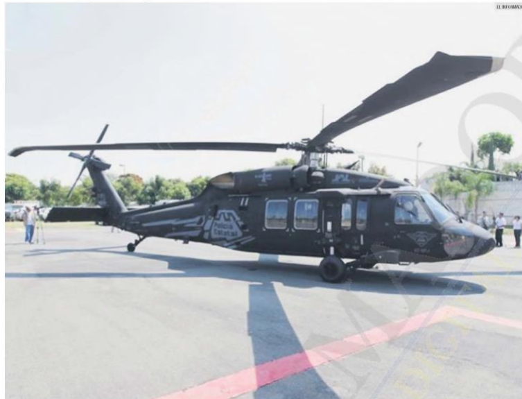
LOGRO. Durante el sexenio de Emilio González, el helicóptero Black Hawk se describió como una aeronave "caracterizada por su utilidad en situaciones de alto riesgo".

LA CIFRA 17'749,000 dólares gastó el Gobierno del Estado en 2011 para comprar el helicóptero Black Hawk a la empresa estadounidense Sikorsky.