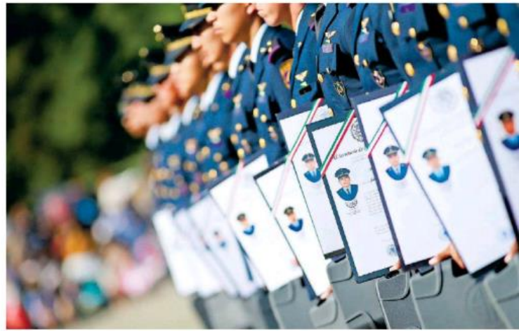
Los graduados recibieron reconocimientos de parte del gobernador.

nández Mercado, director del Colegio del Aire, informó que culminaron estudios 91 pilotos aviadores; 31 meteorólogos militares; 31 controladores de vuelo; 18 especialistas en mantenimiento de aviación; 9 abastecedores de material aéreo; 19 especialistas en electrónica de aviación y 11 de armamento aéreo, en las que se encuentran 13 mujeres, un becario de la República