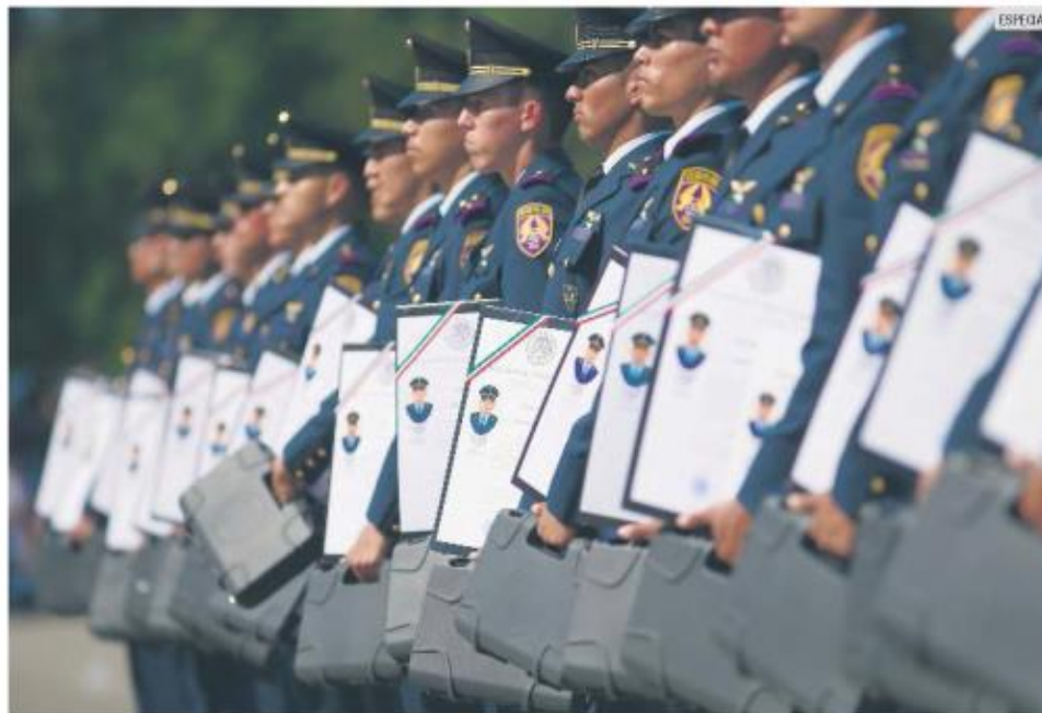
NUEVA ETAPA. Entre los graduados hay oficiales en instrucción, meteorólogos y pilotos aviadores.