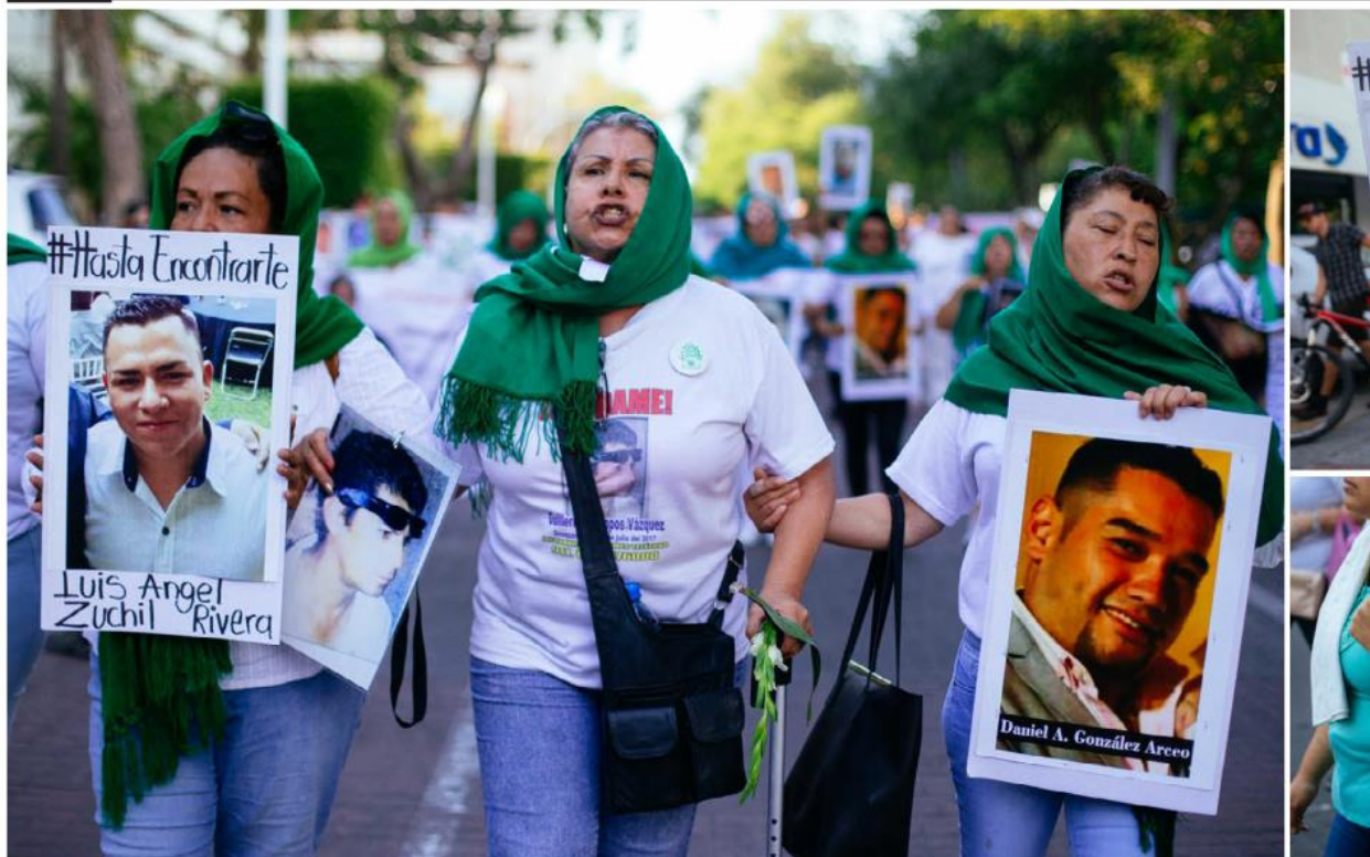
Pedían la reaparición con vida de sus familiares y amigos. Caminaron rumbo al poniente, entre gritos, consignas y llanto. FERNANDO CARRANZA