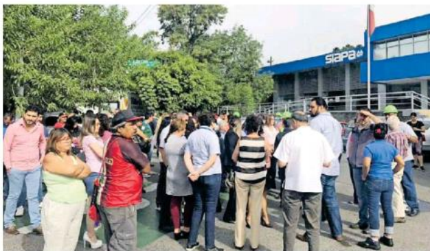
Es el último día para aprovechar el 90 por ciento de descuento en recargos.