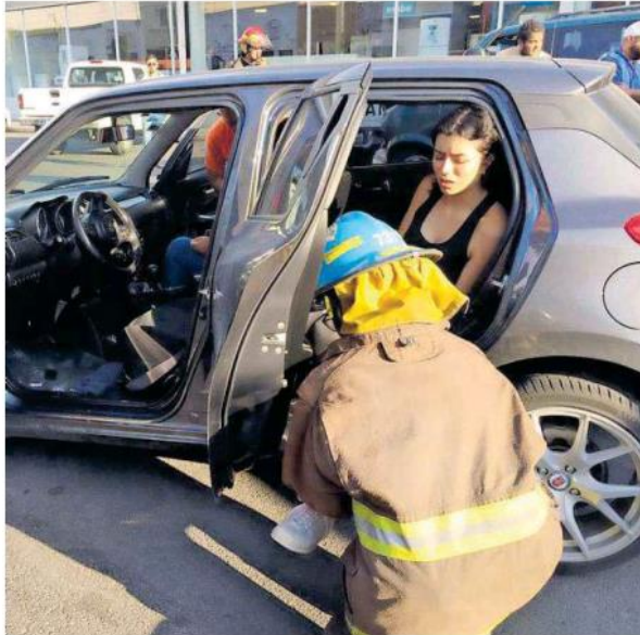
Tres personas resultaron con lesiones.

Se trataba de un automóvil Suzuki de color gris, con placas del Estado de Méxi-