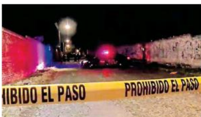
Un homicidio ocurrió en el cruce de López Mateos y La calle Las Huertas.

SE REGISTRÓ en la localidad de La Estanzuela, en donde quedaron varias camionetas con decenas de impactos de bala, armas de fuego de diferentes calibres y equipo táctico, que fueron asegurados por las autoridades de Michoacán.