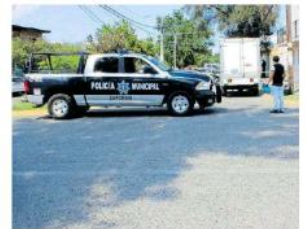
Fue en la confluencia de Lucio Blanco y Nuevo México.

Cuando los policías municipales llegaron, encontraron tendido al hombre en el suelo, mismo al que se le apreciaban va-