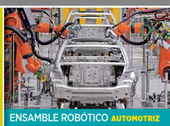
ENSAMBLE ROBÓTICO AUTOMOTRIZ

TODA UNA VIDA Ignacio López Tarso, de 94 años, 71 de ellos en cine, televisión y teatro, recibió de parte de la Ciudad de México su Declaratoria de Patrimonio Vivo. GENTE