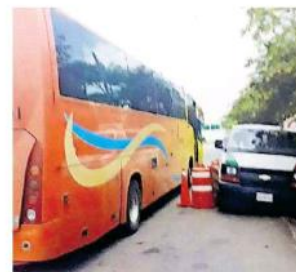
Fue detenido el 12 de agosto 2018 en la carretera federal 15 Tepic-Mazatlán.

Por lo anterior, el sentenciado se encuentra interno en el Reclusorio de la Zona Metropolitana de Guadalajara, ubicado en Puente Grande, donde lleva a cabo su condena.