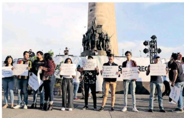
Se congregaron en la llamada Glorieta de los desaparecidos.

La concentración de la Glorieta de los Niños Héroes, bautizada por los colectivos como la Glorieta de las personas desaparecidas, fue emotiva ya que se recordaron los nombres de muchos de ellos al mismo tiempo de que aseguraban no darse por