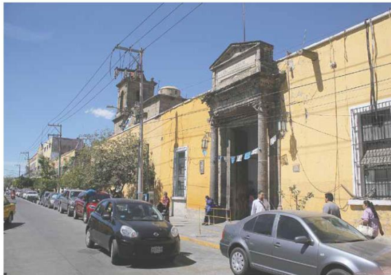
ATACADO. Personal del Servicio Médico Forense recogió en el Hospital Civil el cuerpo de un hombre que falleció a causa de heridas por arma de fuego.

TRES HERIDOS Choca taxi contra camión gasero Un taxi se estrelló contra la parte posterior de un camión repartidor de gas en la colonia San Andrés, Guadalupe, resultando heridos tres ocupantes del vehículo de alquiler. Las personas lesionadas eran un hombre y dos mujeres que resultaron con contusiones de consideración regular, quienes fueron trasladadas a recibir atención médica a la Cruz Verde Ruiz Sánchez. Los servicios de emergencia atendieron el reporte a las 9 horas de este viernes, aproximadamente, por avenida Francisco Javier Mina a la altura de la calle Lagunas. Las rescatistas realizaron maniobras para especializar al copiloto en la parte más dañada. Juan Levario