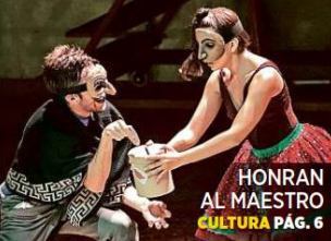
HONRAN AL MAESTRO CULTURA PÁG. 6

"Se manejarán con documentos y documentados en series de televisión y documentales de Estados Unidos", enfatizó.