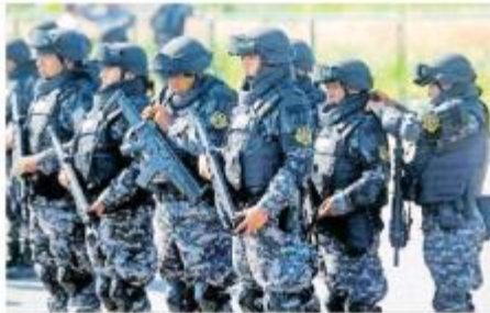
La OPD Policía Metropolitana de Guadalajara.