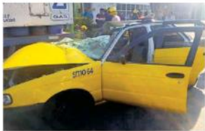
El vehículo de alquiler del sitio 64.

El accidente ocurrió en la confluencia de Javier Mina y Lagunitas, en la colonia San Andrés, en el municipio de Guadalajara. Hasta ahí llegaron elementos de la Dirección de Protección Civil y Bomberos