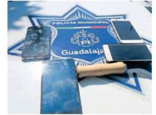
Amagó con un cuchillo para despojar de un celular.

De acuerdo con la referida corporación, sólo uno de los ocho lesionados, tenía lesiones de consideración, como lo es una posible fractura en codo y radio. Pese a ello, tanto esta persona como el resto de los heridos firmaron desistimiento médico y se quedaron a la espera de su seguro médico.