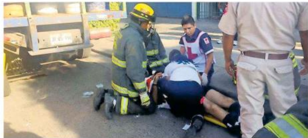
Dieron atención a dos mujeres de aproximadamente 25 años y un hombre de 35 años.