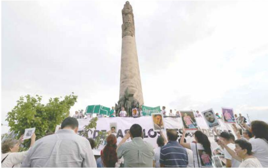
PROTESTA. Los manifestantes salieron en punto de las 18 horas de la explanada del Expiatorio con rumbo a la llamada Glorieta de los Desaparecidos.