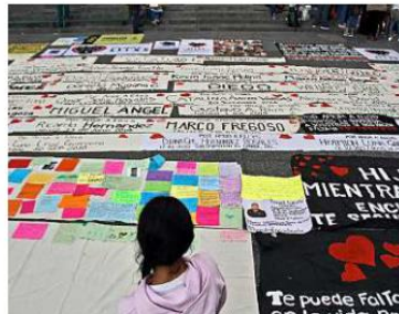
Frente al Teatro Degollado se hizo un tapiz con lonas en memoria de los desaparecidos.

Previo a la marcha también se ofreció una misa por las personas desaparecidas.