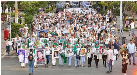
De acuerdo con la Policía Vial, alrededor de 700 personas participaron en el contingente.