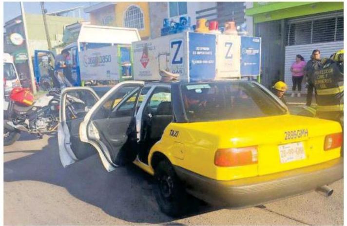
El accidente ocurrió en la confluencia de Javier Mina y Lagunitas.

"Ya platicando con lo que es con el conductor del camión refiere él únicamente se encontraba subiendo un cilindro a un domicilio donde se encuentra parqueado;