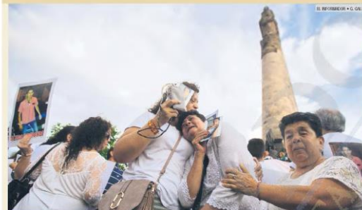
JUSTICIA. En el marco del Día Internacional de las Víctimas de Desapariciones Forzadas, al menos 600 personas que buscan a familiar realizaron dos manifestaciones en el Estado, una de ellas culminó en la Glorieta Niños Héroes. Entorpeciendo camiones que abordan el tema de las desapariciones, los familiares de las víctimas exigieron el regreso con vida de sus seres queridos. Además, afuera del Teatro Degollado, como una acción para pedir justicia, tascaron con nombres de las víctimas y mensajes los alrededores del recinto. En Jalisco, se estima que hay más de siete mil personas cuyo paradero es desconocido, según cifras de la Fiscalía del Estado.