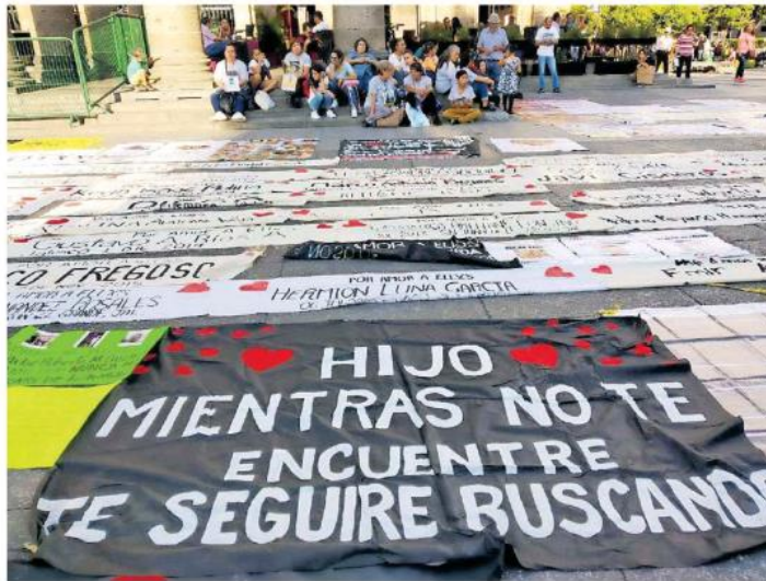
Colocaron sus pancartas en la Plaza de la Liberación.