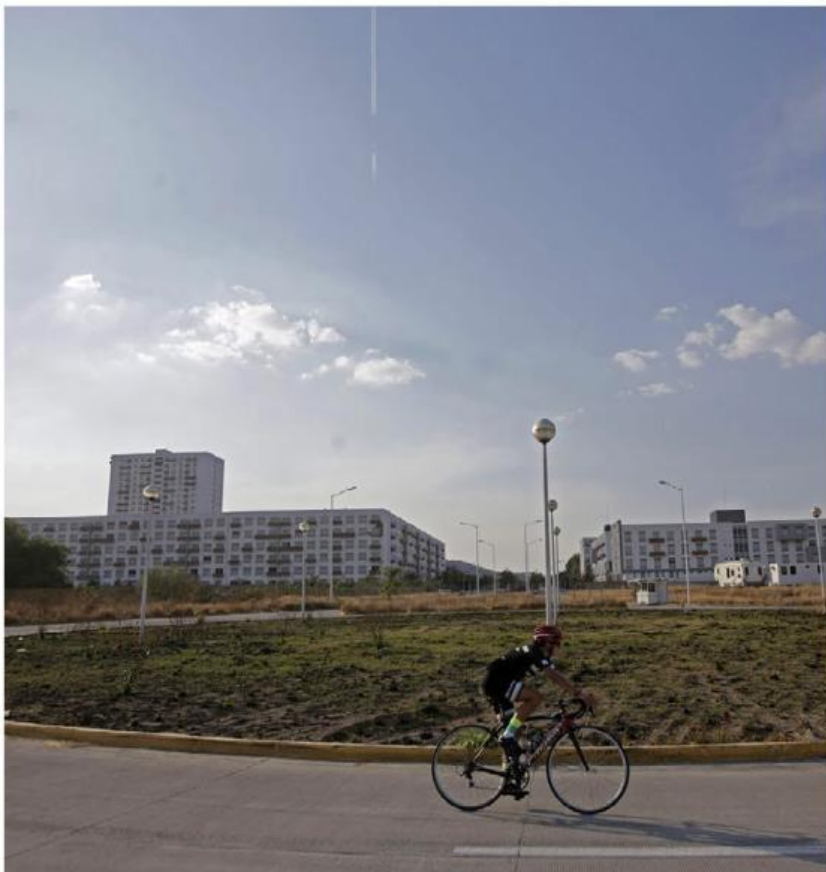
Esta semana se anunció la venta del espacio, actualmente abandonado. FERNANDO CARRANZA

"Por si fuera poco acabamos de recibir una suspensión que permite al particular, al socio desarrollador de la Villa, el continuar con todos sus permisos y gestiones. Yo creo que no es la for-