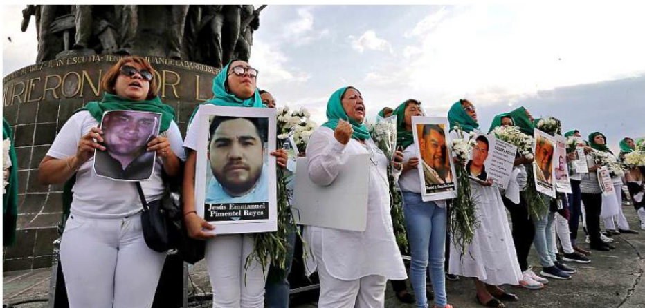
Los gritos como "Hijo escucha, tu madre está en la lucha" o "Vivos se los llevaron y vivos los queremos", se escucharon con fuerza durante la marcha de ayer.