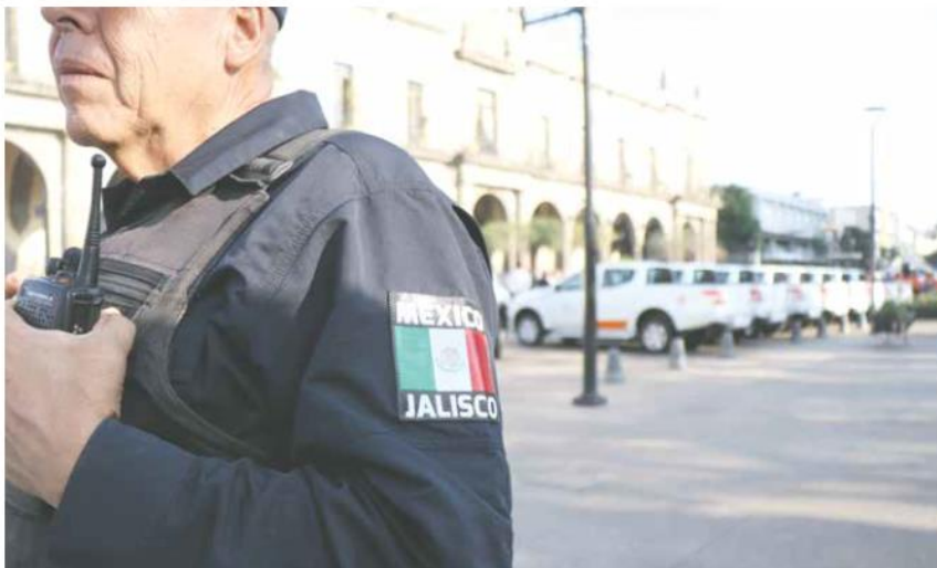
GRIS EL PALARITO