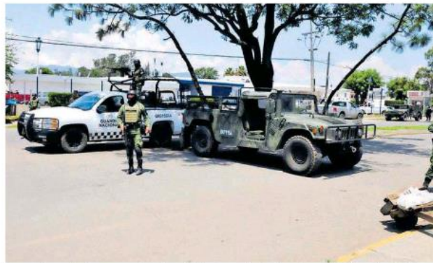
Poco después llegaron efectivos de la Guardia Nacional y de la Fiscalía del Estado.