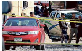
■ En Lomas del Cuatro balearon a dos, uno murió.