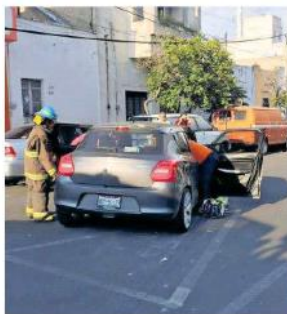
El accidente se dio en las calles Vidrio y Argentina.

co, a bordo iban tres personas las cuales resultaron con lesiones.