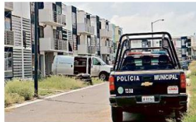
■ Policías hallaron un cadáver en Villa Fontana Aqua.