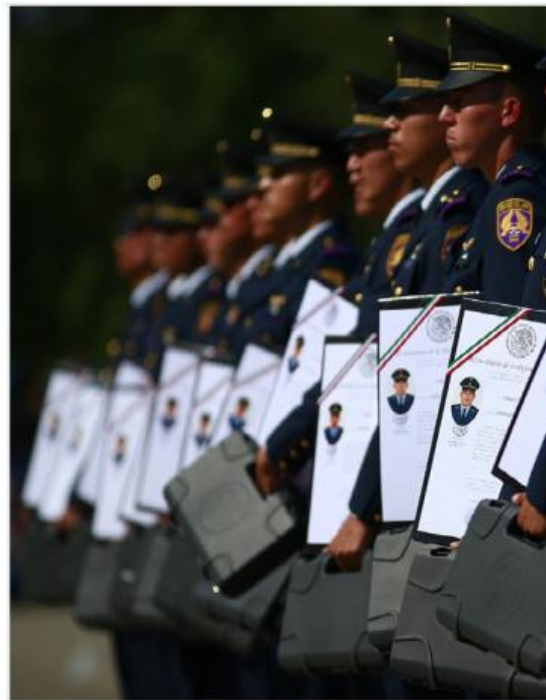
Pronto los elementos se incorporarán a misiones.

Al evento asistió el titular de la Secretaría de la Defensa Nacional (SEDENA), Luis Crescencio Sandoval González, así como José Rafael Ojeda Durán, secretario de la Marina Armada de México y el gobernador de Jalisco, Enrique Alfaro Ra-