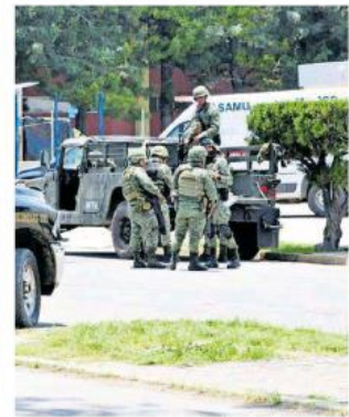
Los elementos de Tránsito Municipal desviaron la circulación vehicular.