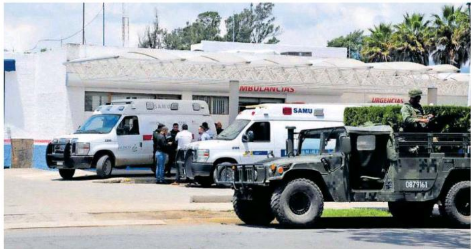
Un convoy de cinco ambulancias y cinco unidades del Ejército Mexicano llegaron al Hospital Regional.

La Fiscalía General de Michoacán confirmó un muerto en los enfrentamientos registrados entre integrantes del CJNG y un grupo antagonista que encabeza Juan José Farías alias "El Abuelo", en Tepeque.