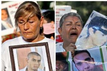
Los familiares participaron de la marcha de ayer vestidos de blanco y muchos de ellos con fotografías de los ausentes.