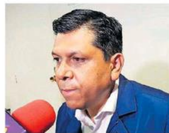
El presidente de la fracción, el diputado Gustavo Macías Zambrano.

También, cuando el autor del delito se valiese del uso de drogas, como narcóticos, psicotrópicos y estupefacientes que anulen la voluntad de la víctima, para cometer el delito y cuando la violación sea cometida aprovechando los medios o circunstancias que proporcionan el empleo, cargo o comisión que el autor del delito ejerza, en cuyo caso éste será privado o suspendido, del ejercicio del empleo, cargo o comisión por el término de la pena de prisión que se le imponga.