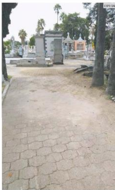
LIBRE. Así luce ahora el lugar donde había restos de plantas y otro tipo de desechos.