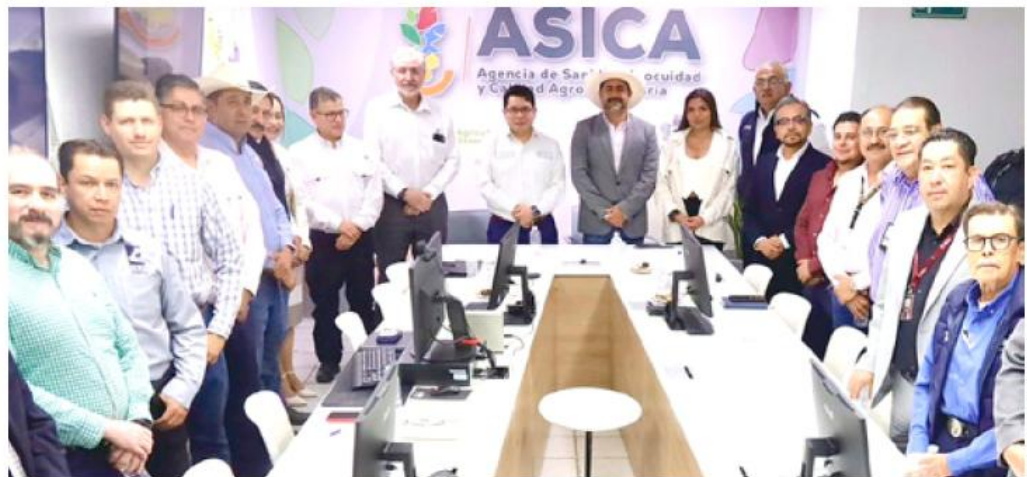
Un grupo de expertos recopilarán y analizarán la información para actuar a tiempo.

La estrategia es resultado del trabajo conjunto entre la Secretaría de Agricultura y Desarrollo Rural de Jalisco (Sader) y el Servicio Nacional de Sanidad, Inocuidad y Calidad