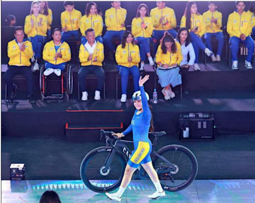
Desde el 2000, Jalisco ha sido el monarca en la Olimpiada Nacional; hoy arranca la edición 2026.