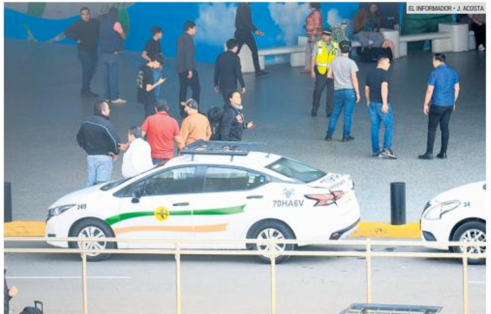
OPCIÓN. Taxi autorizado brinda servicio dentro del Aeropuerto Internacional de Guadalajara, en contraste con el esquema propuesto para plataformas.

Otro de los temas abordados fue la operación del servicio durante los partidos del