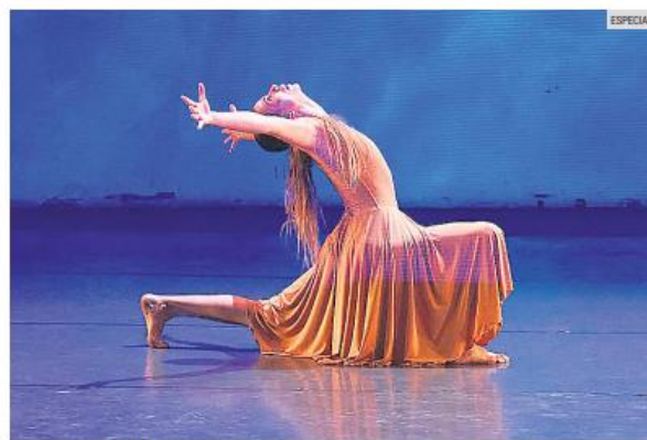
"LOS AMOROSOS". La propuesta, que se presenta el sábado 18 de abril, está inspirada en un poema de Jaime Sabines.

El programa incluirá fragmentos de repertorio clásico, como la suite de "El Corsario", junto con propuestas contemporáneas como Brochazos entre bailarines, inspi-