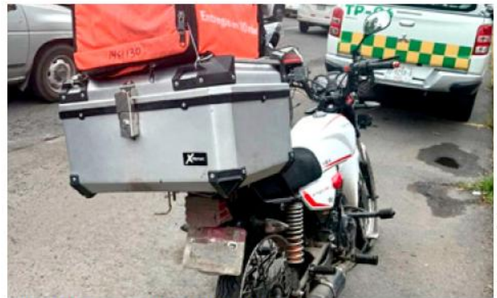
Se ofrecía el servicio a través de plataformas digitales.

Para realizar reportes sobre cualquier irregularidad en el transporte público, la secretaria puso a disposición los números telefónicos 33 3819 2419 y 33 3819 2426, con atención de lunes a viernes de 8:00 a 16:00 horas, así como sus canales digitales.