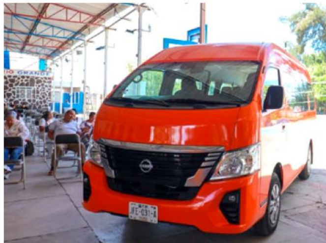
En El Salto se entregó una unidad tipo Nissan Urvan 2025, con valor de 826 mil pesos.

La estrategia busca facilitar el acceso a servicios de salud, educación y actividades básicas para personas que enfrentan dificultades para trasladarse