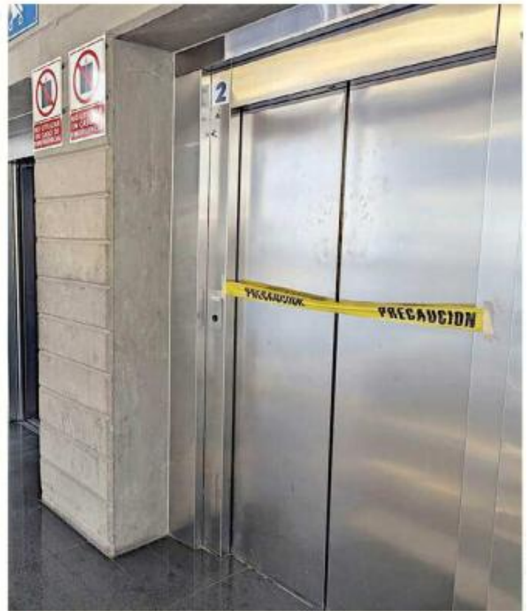
Continúan las fallas en elevador y escaleras eléctricas de la estación Circunvalación Country.

Con esto, los vecinos piden que se atienda el descuido a la estación Circunvalación Country y que se frene el desvío de rutas para que se respeten las para-