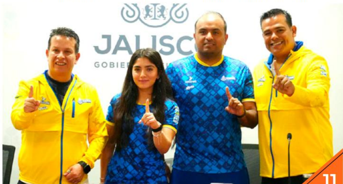
Se espera recibir a más de 7 mil 500 atletas.

Esta edición será especial al conmemorar el 30 aniversario de la Olimpiada Nacional, además de que su calendario fue ajustado por la realización del Copa Mundial de la FIFA 2026 y con el objetivo de descentralizar la organización deportiva en el país.