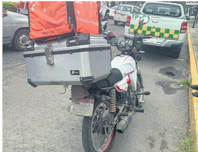
Motocicletas son retiradas de la circulación durante operativo de supervisión por prestar servicio de transporte fuera de la norma.

En este contexto, la Setran hizo un llamado a las empresas para que se abstengan de ofrecer u operar este tipo de servicios, al considerar que contravienen la regulación vigente en materia de transporte. También exhortó a la ciudadanía a evitar solicitarlos, debido a los riesgos que implican para la seguridad vial.