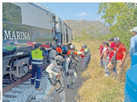
TRAGEDIA. Vagones volcados y fuera de las vías quedaron tras el descarrilamiento del Tren Interoceánico en una curva cercana a Nizanda, en Oaxaca, accidente que dejó 14 personas fallecidas hasta el momento.