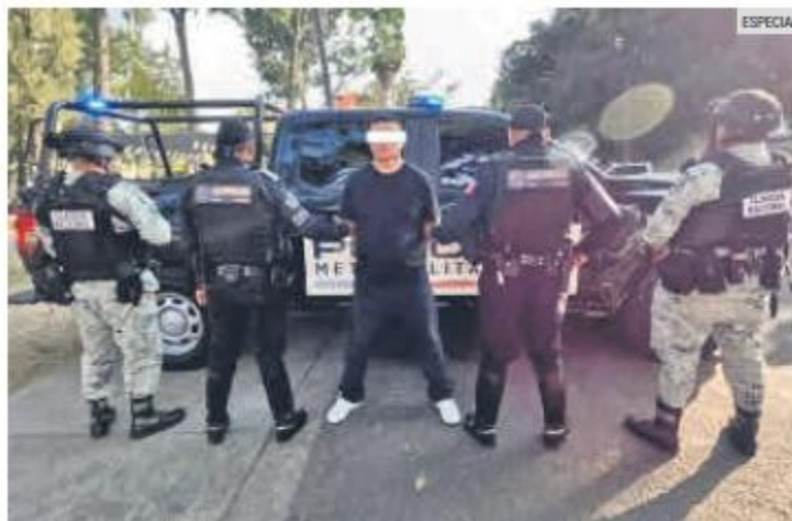
DETENCIÓN. El individuo se identificó como Atemotzin "N", de 42 años de edad.