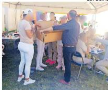
DDS. La convivencia fue promovida por la Dirección de Diversidad Sexual Jalisco.