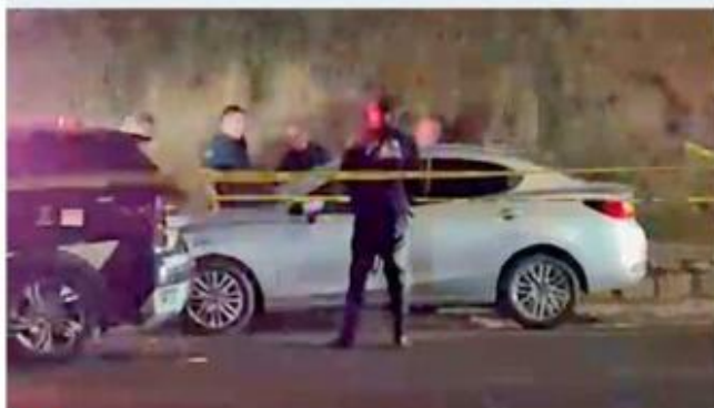
Una de las víctimas quedó en Bugambilias.

La pareja del fallecido, tras ser atacados, decidió acudir a su domicilio para luego ir por ayuda, sin embargo en el traslado se percató que su estado de salud no era conveniente.