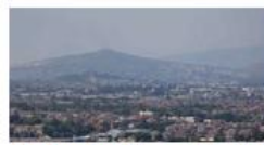
Contaminación ambiental Guadalajara inicia el año con mala calidad del aire