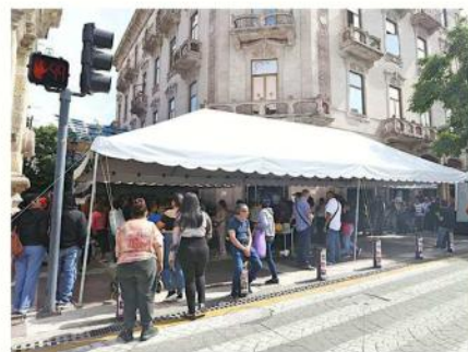
■ En caso de que se acuda a pagar las infracciones a alguna recaudadora el descuento será de sólo 50 por ciento.

Otro estímulo permanente durante todo el 2026 es el descuento del 70 por ciento en el trámite de cambio de propietario.