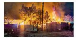
En cinco estados, 21 casos Por pirotecnia y campismo, los incendios de Año Nuevo