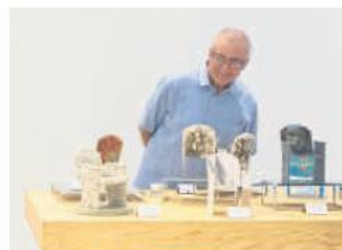
PIEZAS. Butacas intervenidas que llevan el teatro al museo.