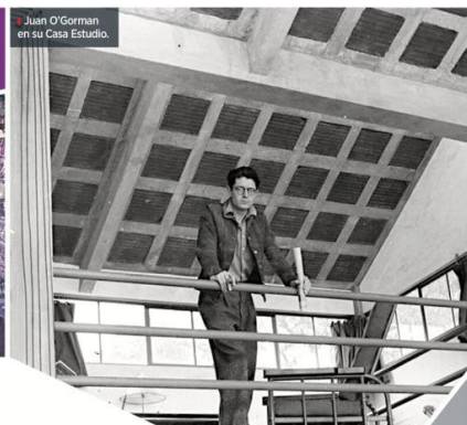
Juan O'Gorman en su Casa Estudio.

Editan dos obras que recuerdan el legado