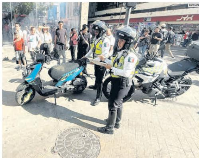
OPERATIVOS. Agentes de la Policía Vial multan a motociclistas en el Centro Histórico de Guadalajara, donde se detectaron infracciones como no portar casco, circular sin placas y estacionarse en sitios prohibidos.