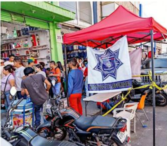
■ La Policía de Guadalajara instaló un módulo de seguridad.