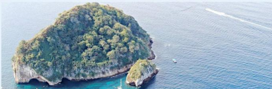
■ La playa de Mismaloya, en Puerto Vallarta, reprobó las pruebas realizadas por la Cofepris.