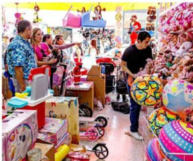
■ Ciudadanos realizaron sus compras en Obregón.