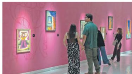
MUESTRA. "Doncella • Madre • Sabia", un diálogo visual sobre lo femenino.

Estará abierta hasta el 8 de febrero de 2026.