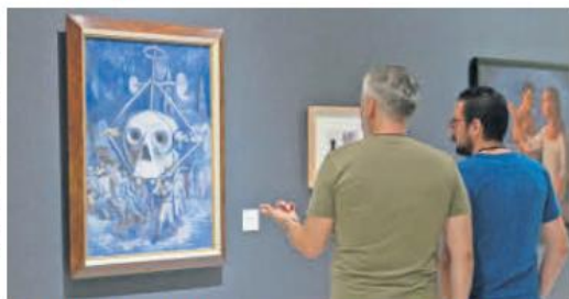
CULTURAL. "Fábulas fantásticas" reúne piezas donde lo maravilloso y lo imaginario dialogan a través de realidades alternas.

las Artes Escénicas, realizada en colaboración con la Coordinación de Artes Escénicas y Literatura de la Coordinación General de Extensión y Difusión Cultural de la Universidad de Guadalajara. Cada pieza fue transformada por un artista, otorgándole identidad propia y convirtiéndola en un objeto artístico que dialoga con el teatro y sus públicos. La muestra también permanecerá hasta el 18 de enero de 2026.