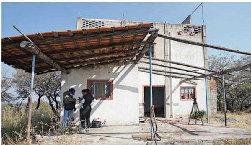
■ Madres Buscadoras de Jalisco localizaron un cuerpo que se cree pertenece a una persona con reporte de desaparición, en la zona de El Calabozo, en Tonalá.

Un grupo de poco más de diez personas subió hasta la cima. Conforme avanzaban, comenzaron a percibir olores fétidos que provenían de la finca, la cual se observaba en aparente estado de abandono.