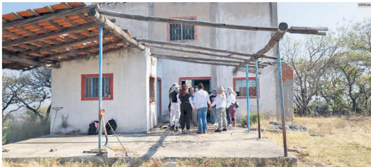
VIGILAN. Integrantes del colectivo Madres Buscadoras de Jalisco y autoridades municipales resguardan la zona del hallazgo en Tonalá.

El hallazgo ocurrió en una finca abandonada ubicada en una zona elevada y de difícil acceso