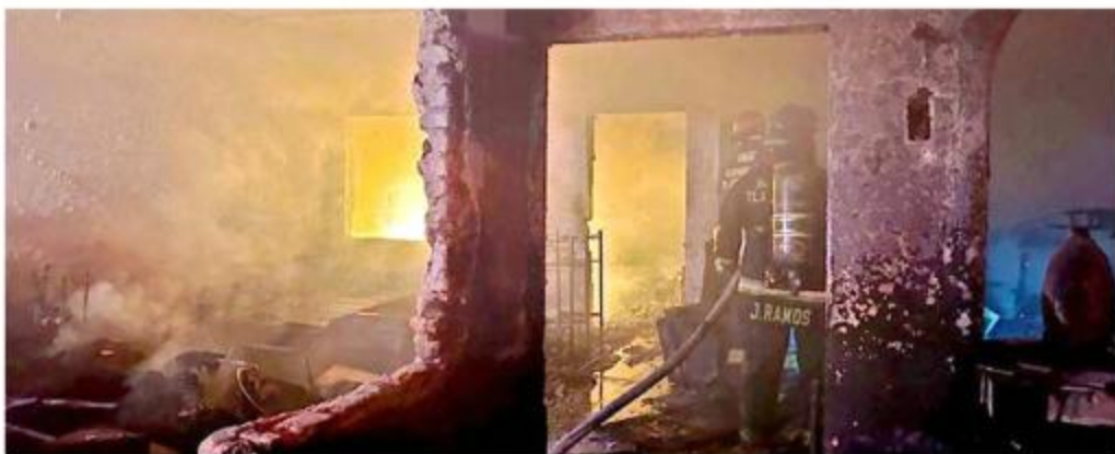
■ Un cadáver fue localizado por Bomberos de Tlaquepaque después de sofocar un incendio; no se pudo determinar la identidad de la víctima.

Los vecinos informaron al personal de Protección Civil que en la casa habita un