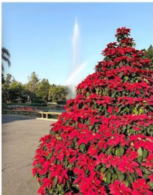
■ El lugar es decorado por un árbol decorado con Nochebuenas.