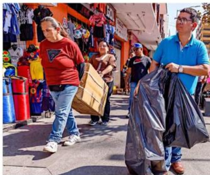
■ Muchas personas cargaban sus bolsas con regalos.