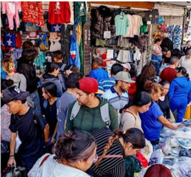
■ Los negocios y puestos de Obregón tuvieron muchos visitantes.