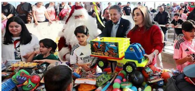
■ Los menores obtuvieron juguetes como carros y pelotas de manos de autoridades zapopanas.

Hacen Operación Regalo en Valle de los Molinos