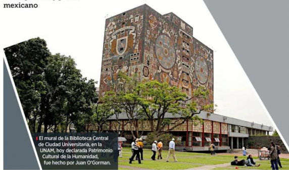
El mural de la Biblioteca Central de Ciudad Universitaria, en la UNAM, hoy declarada Patrimonio Cultural de la Humanidad, fue hecho por Juan O'Gorman.

Este año se conmemoró el 120 aniversario del natalicio del arquitecto y pintor mexicano