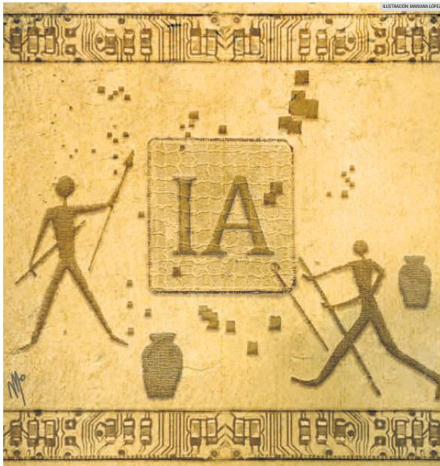
ILUSTRACIÓN: MARIANA LÓPEZ

Crónicas del Antropoceno es un espacio para la reflexión sobre la época humana y sus consecuencias producido por el Museo de Ciencias Ambientales de la Universidad de Guadalajara que incluye una columna y un podcast disponible en todas las plataformas digitales.