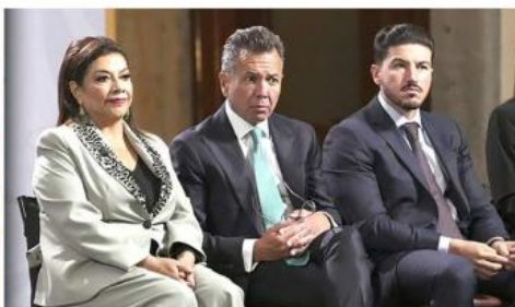
■ Hace dos semanas, Sheinbaum prometió 2 mil millones de pesos por el Mundial a cada una de las tres sedes ante los Mandatarios de CDMX, Clara Brugada; de Jalisco, Pablo Lemus, y de Nuevo León, Samuel García.