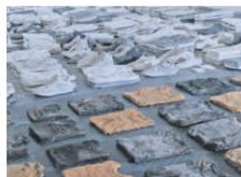
AUSENCIAS. "Ceguera voluntaria" es una exposición que reflexiona sobre la indiferencia ante la desaparición de personas en México.