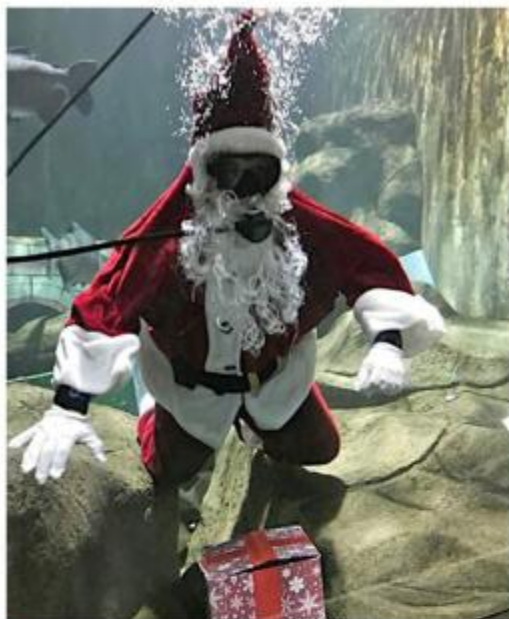
■ El Zoológico Guadalajara es visitado por Santa Clos durante esa época, para deleite de los pequeños.