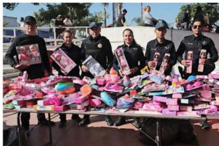
■ Policías de la Comisaría de Zapopan entregaron también muñecas a las niñas asistentes.

"Está muy bien que se hagan esta clase de eventos, nuestros niños se divierten con las obras de teatro y se