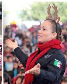
■ El espíritu navideño llegó a Valle de los Molinos.

"Mis niños se la pasaron súper bien, traen sus pelotas, sus carros y aparte pudieron ver la obra que aquí les presentaron los policías", señaló