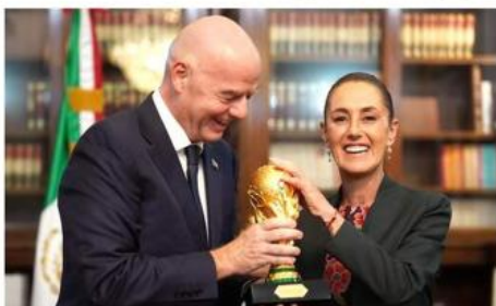
■ Gianni Infantino, dirigente de la FIFA, visitó el 28 de agosto a la Presidenta Claudia Sheinbaum en Palacio Nacional, para conversar sobre los avances de la organización del Mundial 2026 en la CDMX, Guadalajara y Monterrey.

Samuel García, Gobernador de Nuevo, a su vez solicitó deuda por 14 mil 644 millones de pesos para el 2026, que ya fue rechazado por el Congreso local. Ya se verá el próximo año si le autorizan alguna cifra menor.