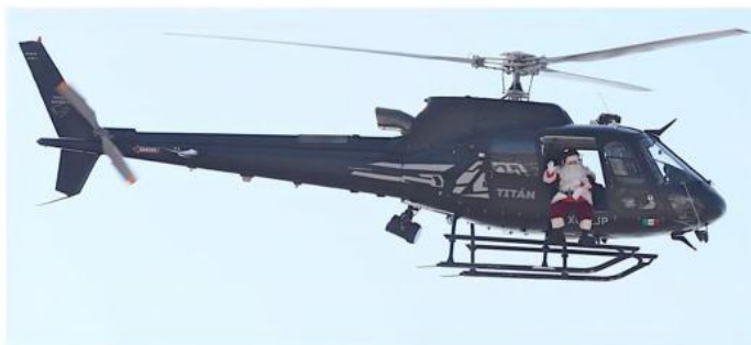
■ Santa Claus llevó alegría a cientos de niños de Valle de los Molinos desde un helicóptero.