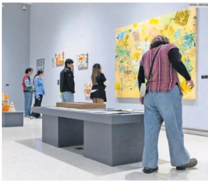
EXHIBICIÓN. La muestra "Orden salvaje" propone un diálogo entre naturaleza, tensión y estructura desde el arte contemporáneo.

El cruce entre artes visuales y escénicas se manifiesta en la exhibición de las butacas intervenidas para los Premios del Público a