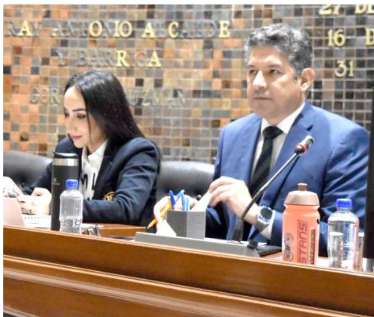
Legisladores exigen atender acoso, deserción y rezago educativo.

En el eje de talento destacaron acciones a favor de la educación especial, atención a primera infancia, artes, combate al rezago educativo y bilingüismo, con la distribución