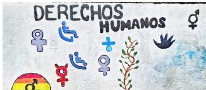
El Día Internacional de los Derechos Humanos es el 10 de diciembre.

"Y en el marco del día, que es el 3 de diciembre, que