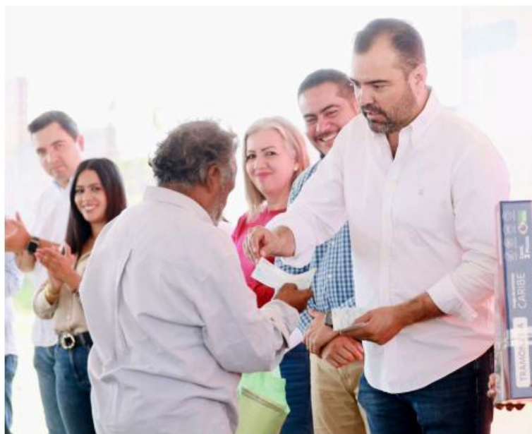
Los fraccionamientos Los Sauces y Geovillas La Arbolada fueron los beneficiados.

“Por eso hoy quiero que sepan que vamos a generar, precisamente con el apoyo de la Secretaría de Asistencia Social y lo que le tocó también al municipio, una inversión o más bien una erogación de 6 millones 807 mil pesos. Son 39 cheques de Geovillas, 150 de Los Sauces. Tenemos ahí la oportunidad también de que, por medio de su