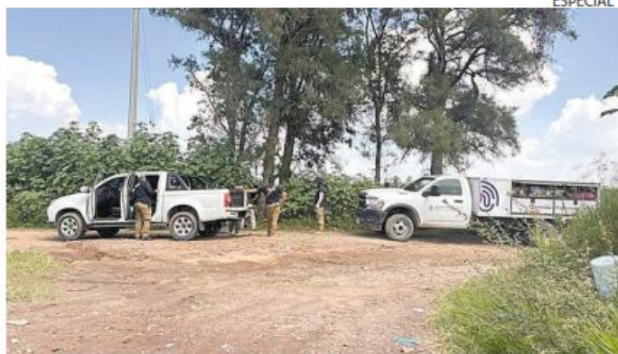
PERSONAS OCCISAS. En la fosa de Camino al Alemán se han hallado 16 cuerpos de forma preliminar y siete ya fueron preidentificados.

Según datos de Manos Buscadoras y Guerreros Buscadores, colectivos