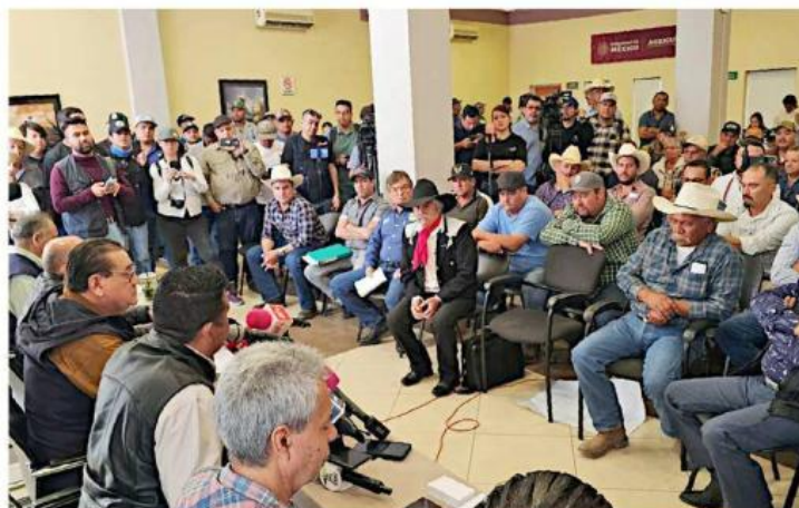
Decenas de productores de maíz fueron recibidos ayer en la sede de Sader federal en Jalisco, ubicadas en Tlaquepaque.