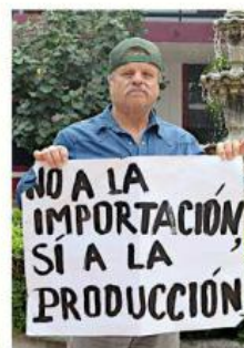
Los productores acusan desplazamiento por las altas importaciones de maíz.

metidos por los Gobiernos, la industria se ha mantenido al margen, sin establecer contratos, lo que paraliza la comercialización en plena temporada de cosecha.