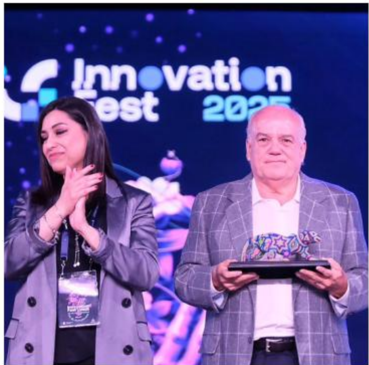
El encuentro reunió líderes y nuevos talentos.