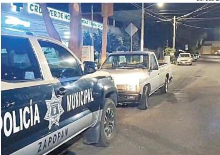
DECESO. Una de las víctimas de la riña entre pandillas falleció en la Cruz Verde Norte.

En medio de la intervención los uniformados lograron detener a un joven de 19 años, a quien se le aseguró un arma de fuego calibre 22 ti-