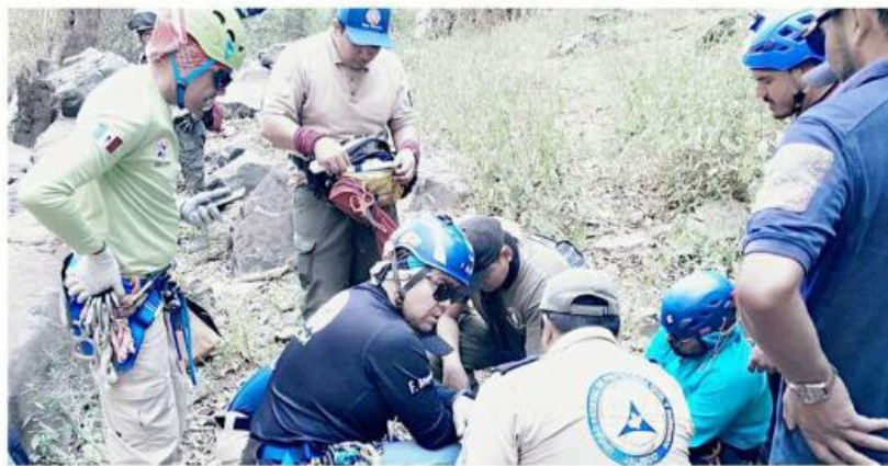
Una de las personas tuvo una lesión, pero estaba estable.

la coordinación, su estado fue considerado estable en todo momento.