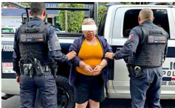
■ Su captura se dio en Loma Real, en Tonalá.