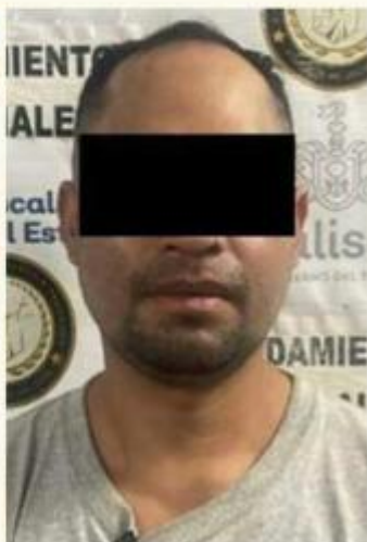
■ Jorge "N"