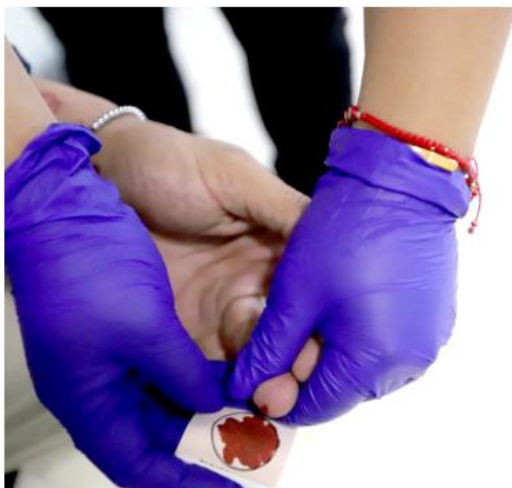
Las y los interesados deberán agendar previamente una cita vía llamada telefónica o WhatsApp.

Posteriormente, se tomará la muestra de ADN a algún familiar