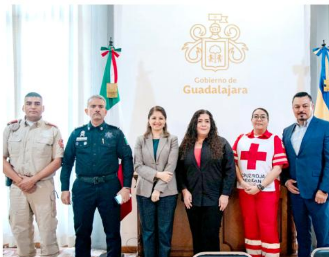
El año pasado brindaron cinco mil 729 servicios.

Del 1 de diciembre al 18 de febrero brindarán apoyo especial para proteger a personas en situación de calle