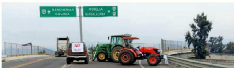
■ Uno de los 5 bloqueos en Jalisco se dio en el kilómetro 87 de la carretera Acatlán de Juárez-Colima, a la altura de Ciudad Guzmán.

En Jalisco se reportó el cierre total a la circulación en la Autopista México-Guadalajara, a la altura de la caseta de Ocotlán; de la carretera Irapuato-Guadalajara, a la altura de Atotonilco El Alto; de la vía La Barca-Atotonilco, así como del ramal La Barca-Jiquilpan, a la altura del kilómetro 10, de acuerdo con la Secretaría de Infraestructura, Comunicaciones y Transportes (SICT).