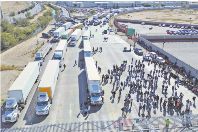
PARALIZACIÓN. Cientos de tráileres y vehículos de campesinos se estacionaron en diversos puntos carreteros del país y en aduanas, entre ellas la de Ciudad Juárez (foto). Señalan que el Gobierno federal no atiende sus demandas.

Los bloqueos de productores y transportistas afectaron ayer una veintena de Estados. El cierre en Manzanillo golpeó el traslado de mercancías. Y sigue la incertidumbre