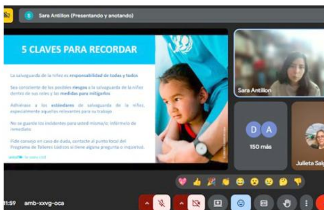
Se presentaron ejemplos prácticos para identificar situaciones de riesgo, entre otras acciones.

La sesión formó parte de la Primera Jornada Estatal de Prevención del Abuso Sexual Infantil 2025. El ejercicio reunió a 150 funcionarias y funcionarios