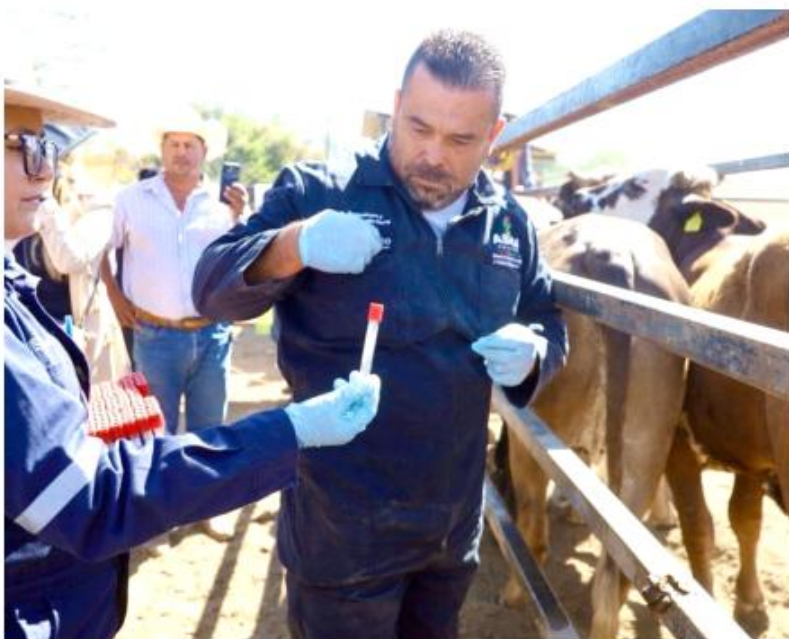
Sader Jalisco y Asica, mantendrán la vigilancia en zonas de riesgo.

La Secretaría reitera el llamado a la población para que no toque, manipule ni destruya las trampas, ya