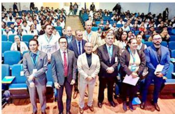
Realizan el Encuentro para la Prevención de Accidentes en la Universidad Cuauhtémoc.