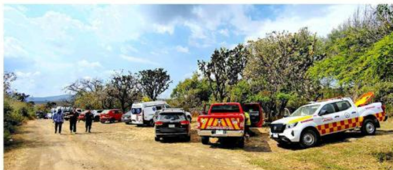
Los excursionistas tuvieron que pasar la noche en la zona de la cascada.

Entre ellos también fue auxiliado un hombre de 57 años, vecino de Tonalá, quien resultó lesionado en una de sus extremidades inferiores y requirió apoyo especial para su traslado. Aunque su lesión complicó parcialmente