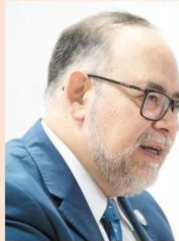
A CARGO. Los detalles los presentó el subsecretario de Derechos Humanos.