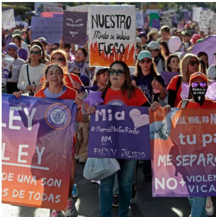
Durante 2023 se documentaron 139 asesinatos de mujeres.

La violencia familiar, la feminicida y la institucional son las más frecuentes en el estado. Solo en 2024 se registraron 11 mil 200 nuevas carpetas por violencia familiar, un 17 por ciento menos que en 2023, pero la Encuesta Nacional sobre la Dinámica de las Relaciones en los Hogares 2021 indica que el 40.6 por ciento de las mujeres jaliscienses que han tenido pareja han sufrido violencia en este ámbito. Las agresiones incluyen golpes, ame-