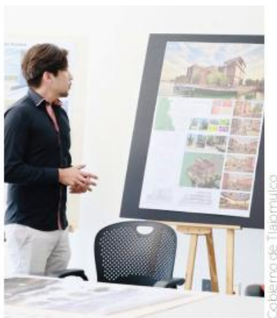
Estudiantes del octavo semestre de la licenciatura en arquitectura mostraron ideas.