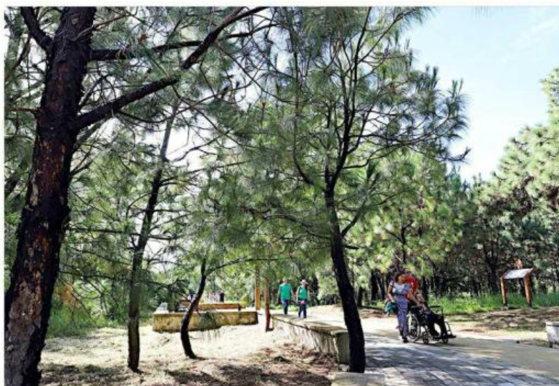
Una empresa que buscaba invalidar el decreto que declaró como Área Natural Protegida la zona del Bosque Colomos.

El tribunal determinó que la empresa no tiene interés jurídico para reclamar el polígono nuevamente, lo que significa que el Ampa-