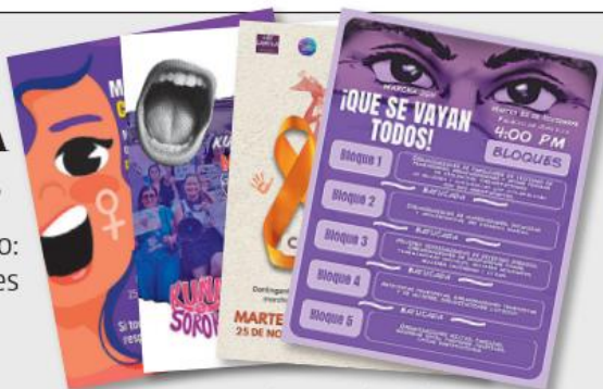
Carteles de convocatoria a las manifestaciones. ESPECIAL