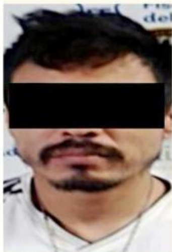
■ Vicarlo Visrrael "N"