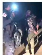
■ Policías zacatecanos detuvieron a cuatro agentes potosinos la noche del domingo.

Además se informó que los cuerpos encontrados, eran de 7 hombres originarios de Sauco de la Borda en Zacatecas, donde hace unos días se había reportado su desaparición.