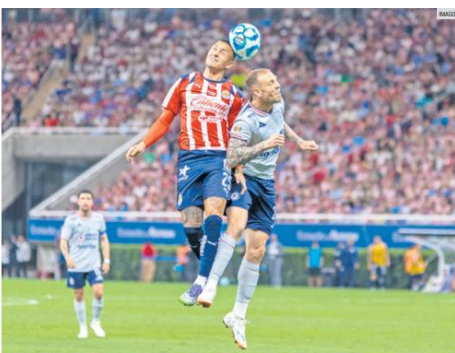
ANTECEDENTES. Chivas y Cruz Azul no se ven las caras en una Liguilla desde la Apertura 2006, cuando Guadalajara avanzó a las Semifinales.

Con esta expansión, el Parque de la Generosidad se perfila como un referente nacional en modelos de apoyo comunitario.