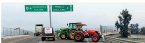
■ Uno de los 5 bloques en Jalisco se dio en el kilómetro 87 de la carretera Acatlán de Juárez-Colima, a la altura de Ciudad Guzmán.

En Jalisco se reportó el cierre total a la circulación en la Autopista México-Guadalajara, a la altura de la caseta de Ocotlán, de la carretera Irapuato-Guadalajara, a la altura de Atotonilco El Alto de la vía La Barca-Atotonilco, así como del ramal La Barca-Jiquilpan, a la altura del kilómetro 10, de acuerdo con la Secretaría de Infraestructura, Comunicaciones y Transportes (SICT).