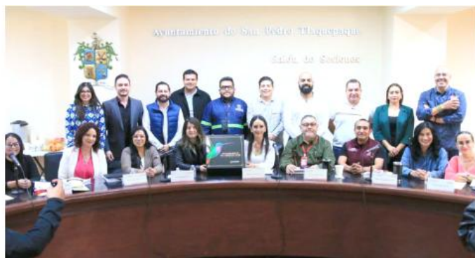
La propuesta plantea un ejercicio por más de 3 mil 174 millones de pesos.

Imelda Pérez Segura precisó que la propuesta financiera está construida con un enfoque centrado en las