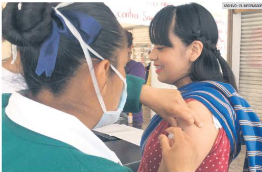
ATENCIÓN. Las brigadas de vacunación refuerzan las acciones en zonas agrícolas, ante el riesgo de la propagación del sarampión.

Precisó que en los campos agrícolas los menores suelen desplazarse entre distintos