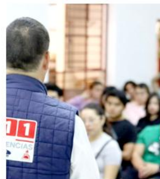
La estrategia contempla vigilancia permanente y una respuesta más ágil.

Estas sesiones incluyen protocolos de actuación, uso adecuado de rutas de evacuación y procedimientos de primer contacto en situaciones de riesgo.