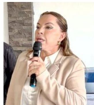
Destacaron los avances en materia de seguridad.

La presidenta municipal reiteró su compromiso de seguir invirtiendo en seguridad y trabajar para consolidar una corporación más fuerte, profesional y cercana a la ciudadanía.