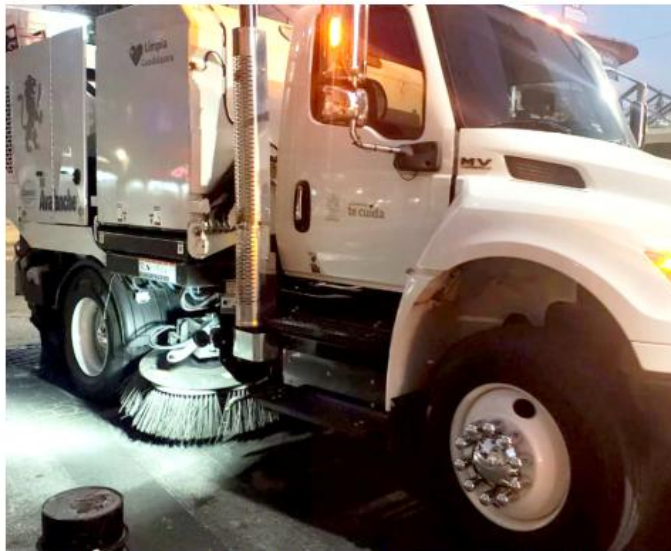
Esta cantidad de desechos representó un desafío para las autoridades municipales.

El Gobierno tapatío, a través de la Coordinación de Servicios Municipales, llevó a cabo un operativo especial de limpieza en el Centro Histórico y en el corredor comercial