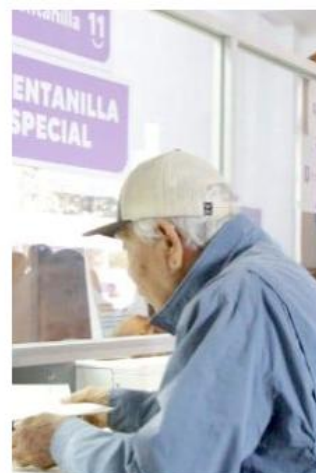
Se registró una alta demanda de contribuyentes durante los primeros días.

Las autoridades municipales indicaron que la diversidad de opciones busca agilizar trámites y facilitar el cumplimiento de obligaciones fiscales para la ciudadanía.