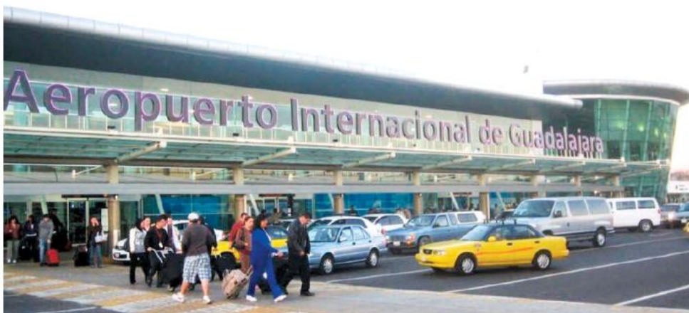
Uno de los detenidos pretendía tomar un vuelo armado con una pistola.