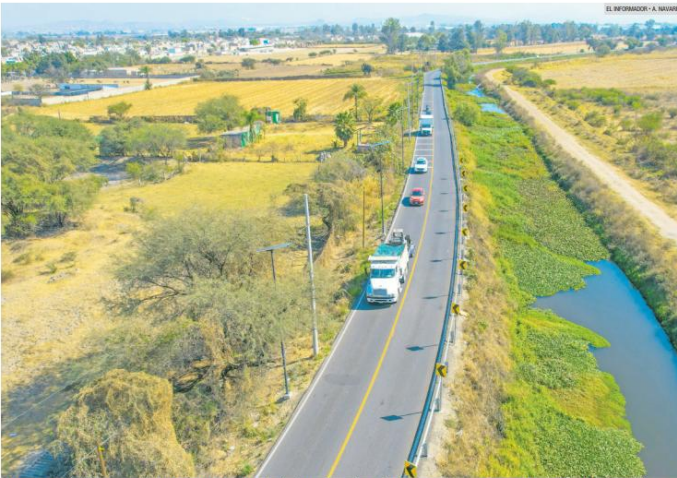
INAUGURACIÓN. Vista panorámica del Camino a El Zapote, modernizado gracias a la inversión impulsada por el alcalde Gerardo Quirino Velázquez. La obra fortalece la conectividad entre el Sur del Área Metropolitana de Guadalajara y el corredor de la Carretera a Chapala.

A partir de julio próximo quedarán inactivas las líneas que no estén debidamente registradas ante las compañías telefónicas, con la intención de frenar delitos