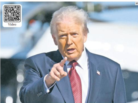
ADVERTENCIA. El presidente de Estados Unidos, Donald Trump, anunció una nueva fase en su estrategia contra el narcotráfico, que contempla ataques terrestres contra cárteles, tras operaciones recientes en el Pacífico y el Caribe.

Con esta intervención, Tlajomulco consolida una red vial moderna, segura y funcional, clave tanto para la atención de eventos internacionales como para el desarrollo permanente del municipio. Y la obra conecta la zona Valle, la más densamente poblada del municipio, con la históricamente segregada Carretera a Chapala, reduciendo tiempos de traslado y mejorando la seguridad vial.