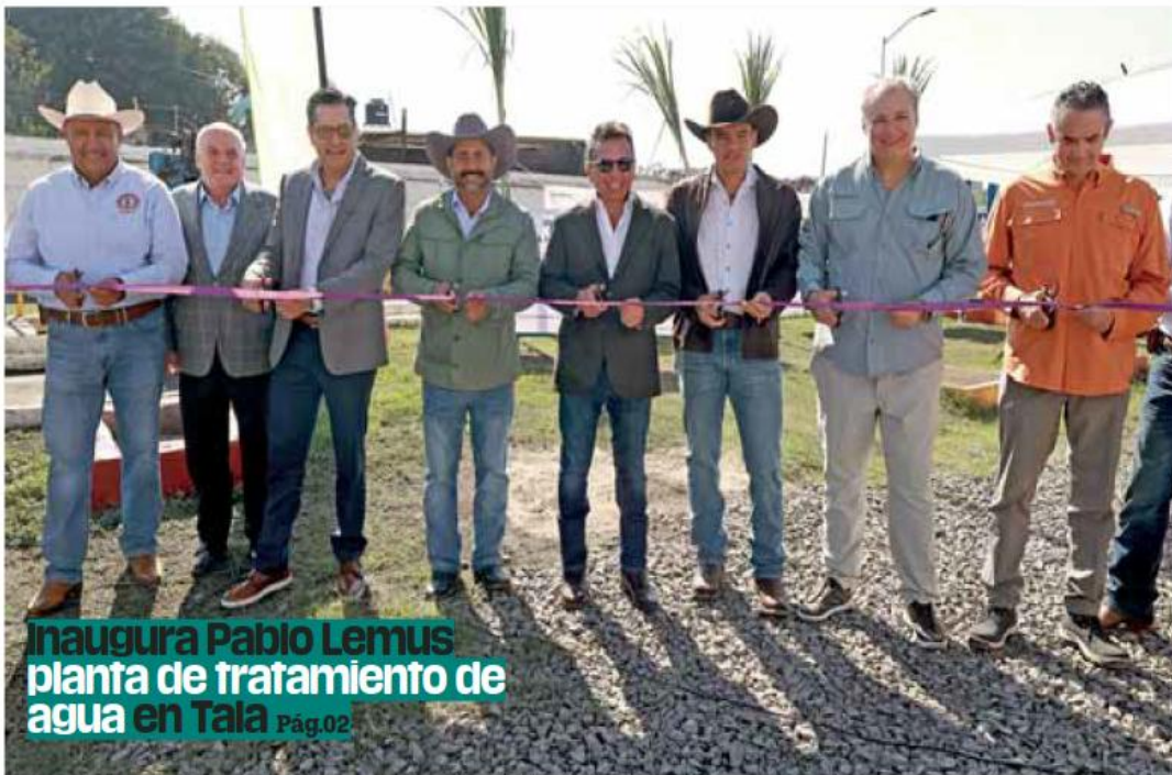
Inaugura Pablo Lemus planta de tratamiento de agua en Tala Pág.02

Seguridad. El combate a la extorsión, homicidio doloso, delitos de alto impacto y tráfico de fentanilo es la prioridad para el Gobierno que muestra una clara tendencia en la reducción de hechos delictivos en 2025. / Pág.04