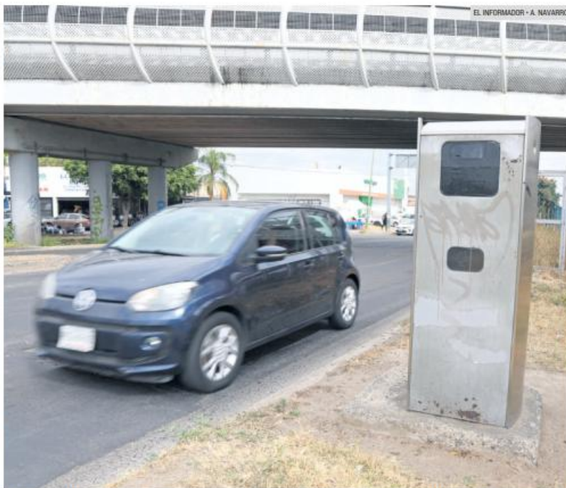
A LA ESPERA. Los ajustes se harán cuando se homologue la señalización horizontal y vertical en la metrópoli.

Finalmente, recordó que la homologación de velocidades forma parte de una estrategia metropolitana contemplada en el Plan Integral de Movilidad Urbana Sustentable, alineada a la legislación estatal y federal y acordada con los municipios metropolitanos y el Gobierno de Jalisco.