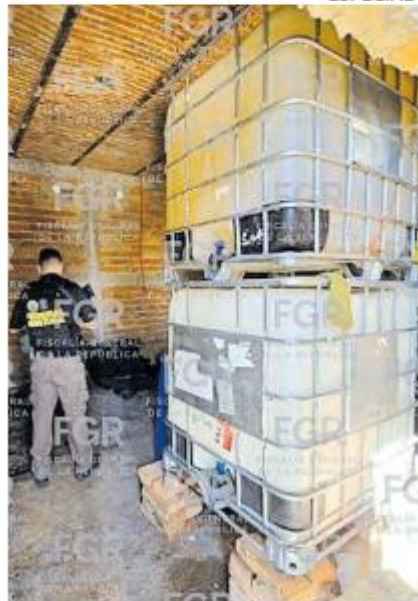
EN LA CIÉNEGA. Los cateos federales se realizaron en Tototlán y Ayotlán.