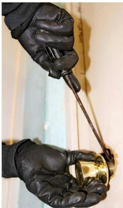
■ Si se le pierden las llaves de su casa, es mejor cambiar las cerraduras.

“Nosotros atendimos un caso donde una señora nos decía que ella dejaba su casa abierta porque tenía miedo de que algo le pasara a sus mascotas. Entonces prefería dejar su vivienda abierta por si se generaba algún incendio, pues que rápido pudieran res-