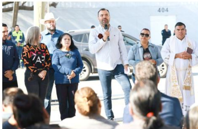
Por ahora, la inversión es cercana a 150 mdp.

• Mejores condiciones para quienes viven en la zona La incorporación de banquetas accesibles, arbolado y señalización