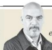
Carlos Puig "Chávez y Maduro expulsaron a una cuarta parte del país" - P. 8

Seguridad. Sheinbaum y Secretariado: pasó cifra de 86.9 al día en septiembre 2024 a 52.4 en diciembre 2025, es decir, 34 menos, nivel más bajo desde 2016; una captura cada 17 minutos con un total de 40 mil 735