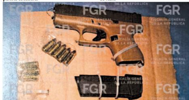
Un hombre iba a abordar un avión armado con pistola en el aeropuerto de Guadalajara.

Detenido en auto sin placas y en posesión de fusil.