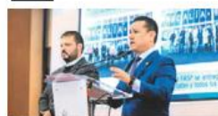
Cómplices del pistolero Cayeron taxista y mensajero ligados a asesinato de Manzo