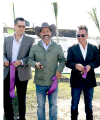
Con agua tratada se avanza hacia un modelo de producción más sustentable.

El agua provendrá de la planta de tratamiento del Ingenio de Tala y será conducida hacia un cárcamo de bombeo para su distribución, cumpliendo con los lineamientos de la NOM-003-SEMARNAT-1997, que regula el reúso de aguas residuales tratadas para proteger la salud pública.