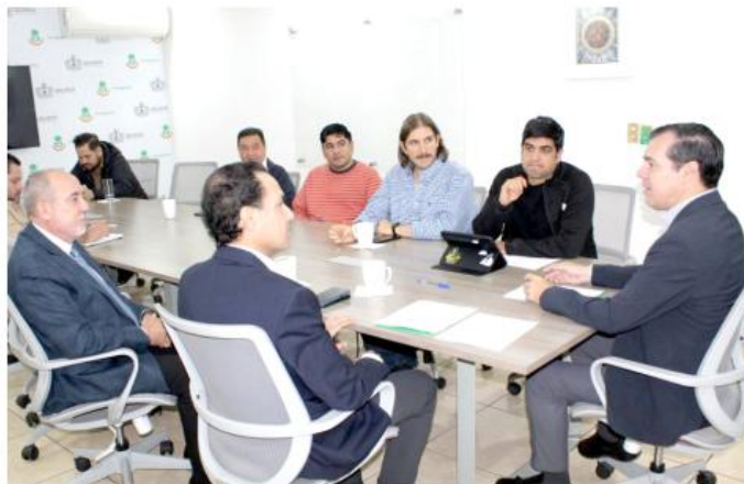
Personal autorizado de las distribuidoras gestionará directamente los permisos de circulación.

¿Qué significa para la gente que compra un vehículo? Menos vueltas y trámites personales. Las agencias podrán hacerse cargo formalmente del proceso, lo que reduce traslados,