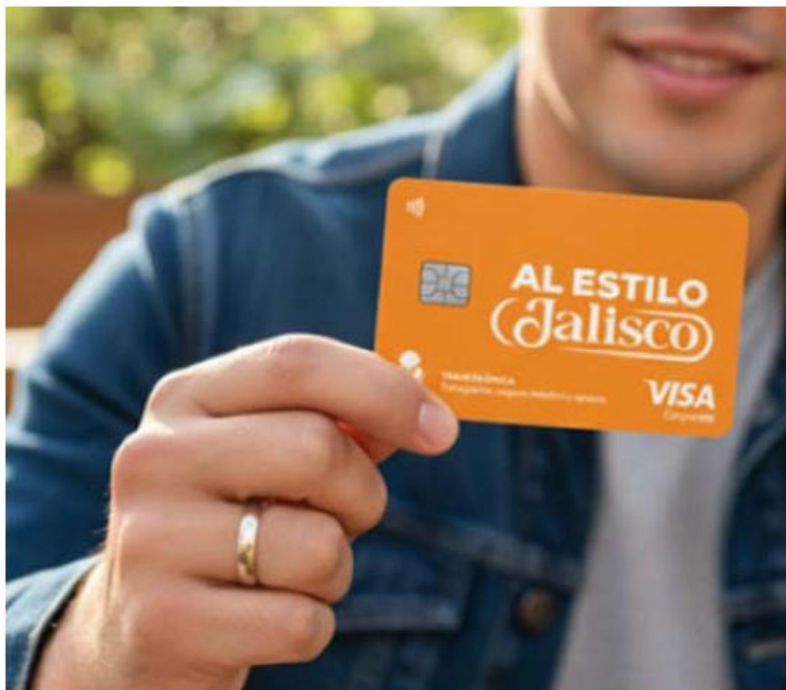
A mediados de diciembre pasado, el gobierno estatal anunció el lanzamiento de la tarjeta.

La investigación realizada por el gobierno federal en contra de la financiera está relacionada con