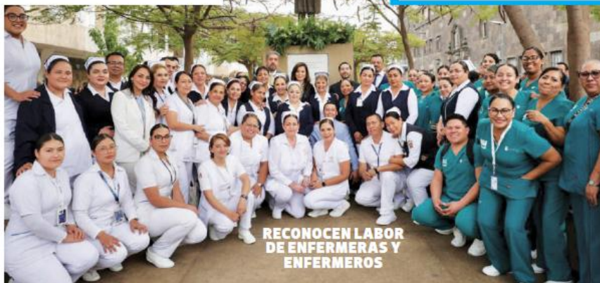
RECONOCEN LABOR DE ENFERMERAS Y ENFERMEROS