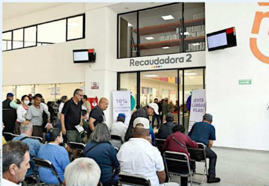
Desde el 2 de enero se han observado largas filas en las recaudadoras para realizar los pagos.