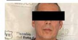
Caso de funcionario de PGJ Capturan a presunto autor intelectual del homicidio