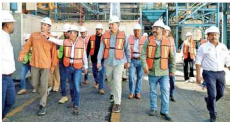
Desarrollo. Tala impulsa caña sustentable con Línea Morada y tecnificación agrícola.