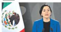
El mayor combate, en NL También decreció crimen en estados de la oposición

"Esta cifra significa 34 casos diarios menos, el número más bajo desde 2016. Este es el reflejo de una estrategia de seguridad que va dando resultados y de una coordinación muy estrecha con los gobernadores", resaltó la mandataria. Con esa tasa, México ha quedado fuera del top 20 de los países con más asesinatos, de acuerdo con información del Banco Mundial. PÁGS. 10 Y 11