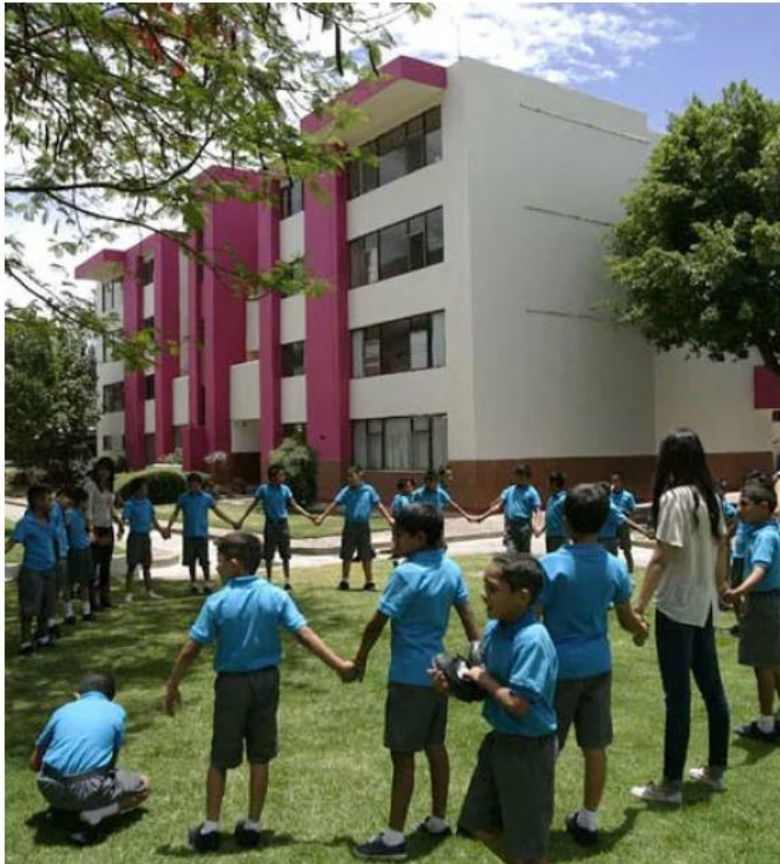
El Hogar Cabañas trabaja para que los niños sean adoptados o integrados a familias de acogida.

Situación. Lemus aseguró que ambas estaban localizadas y a salvo; la Fiscalía del estado dice que solo una fue encontrada