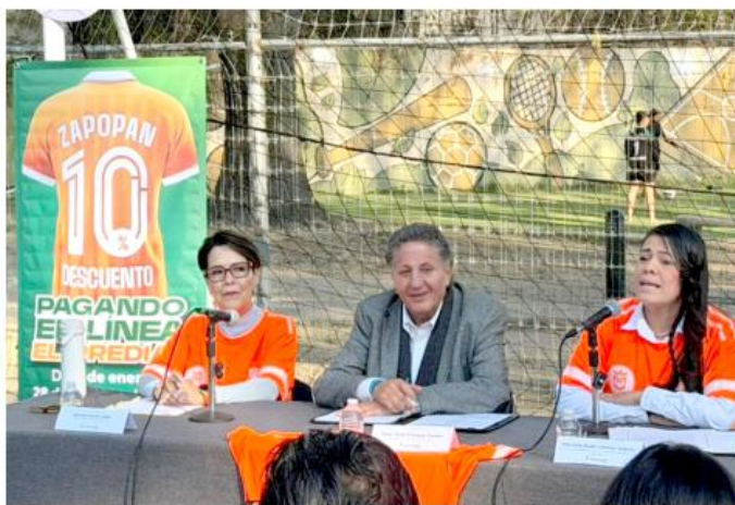
Zapopan superará por primera vez el presupuesto de Guadalajara.

"Está realizada para que la gente tenga garantía de que el pago de su impuesto se va a realizar de alguna