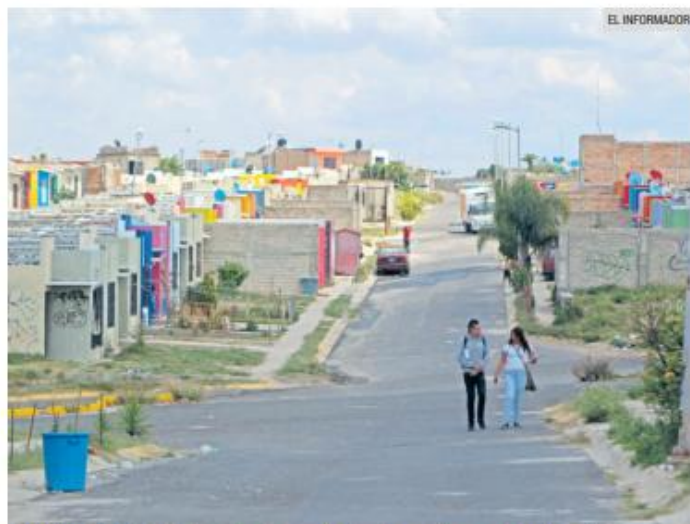
RECUPERACIÓN. Tlajomulco tiene más de cinco mil casas abandonadas con condiciones adecuadas para su rescate.

Sobre el esquema de operación, aclaró que el municipio no tomará posesión directa de los inmuebles. "Son tres mil 500 viviendas que vamos a incluir en un con-