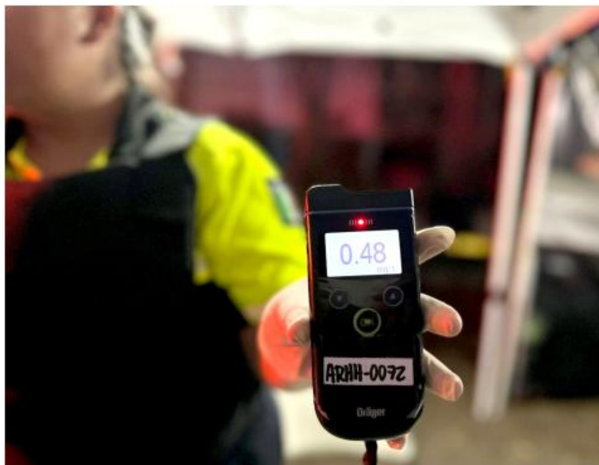
En la temporada 2024-2025, durante el mismo lapso, se realizaron poco más de 69 mil pruebas.

Como resultado del operativo, además de las detenciones por niveles superiores a 0.41 miligramos de alcohol por litro de aire espirado, se retuvieron 263 vehículos y se sancionó a 174 conductores cuyos registros oscilaron entre 0.25 y 0.41