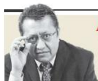
Alfredo Campos Villeda "El problema de percibir el planeta en su primitivo formato de Pangea" - P. 8