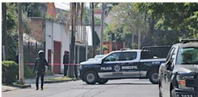
■ Autoridades fueron señaladas por tardar en llegar a una balacera ocurrida el 29 de diciembre en Residencial Victoria.

Añadió que el Gobierno municipal entregó un informe a la autoridad federal, en