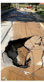
En la misma vía se formó un socavón. Apenas en septiembre tuvieron otra oquedad.

tras una fuga en la misma vialidad, se abrió un socavón donde cayó un carro. Ayer por la tarde se formó otra oquedad en el lugar. Nuevamente acudió personal del organismo a acordonar el área por precaución.