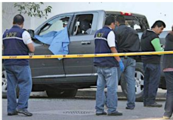
■ El crimen se registró en 2011, en El Batán.

De acuerdo con registros de MURAL, uno de los pri-