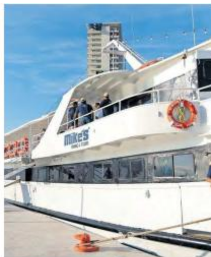
TRANSPORTE MARÍTIMO. La embarcación tiene capacidad para 400 pasajeros.

La puesta en marcha del servicio se da en un contexto de crecimiento del turismo náutico en el municipio, según la Secretaría de Turismo Jalisco (Securjal), pues durante 2025 más de 558 mil personas participaron en actividades marítimas en la región, lo que representó un incremento de 4.5 por ciento respecto al año previo. De manera anual se estima que alrededor de 600 mil visitantes acuden a puntos como el Muelle de los Muertos, Marina Vallarta, Mismaloya y Costa Careyes.