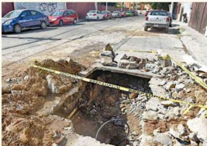
El colapso del pavimento fue a consecuencia de una fuga.