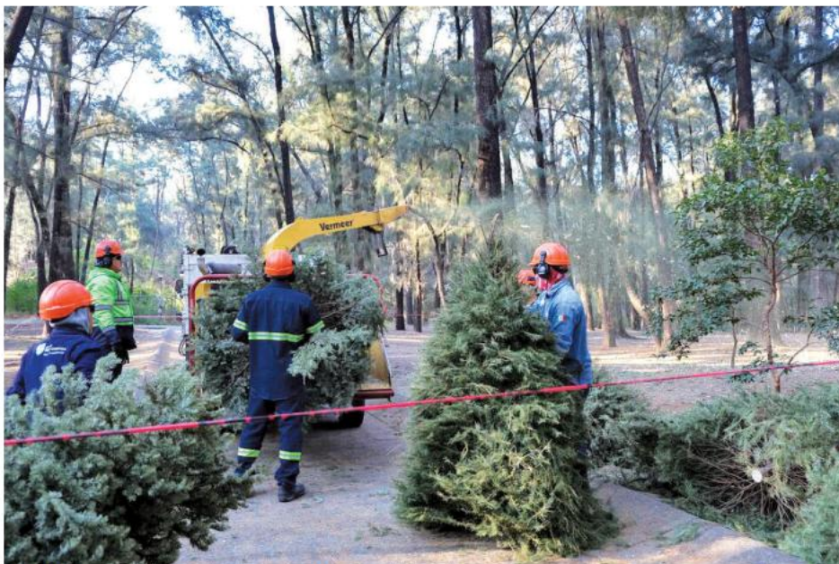
Los árboles serán triturados para producir material orgánico.

Explicó que mil 200 árboles de aproximadamente dos metros de altura