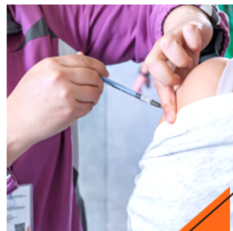
El 67 por ciento de las dosis se aplicaron en brigadas de salud.

Las jornadas de vacunación continuarán en 2026 en todo el estado. La vacuna es gratuita y está disponible en centros de salud, así como en unidades del IMSS e ISSSTE.