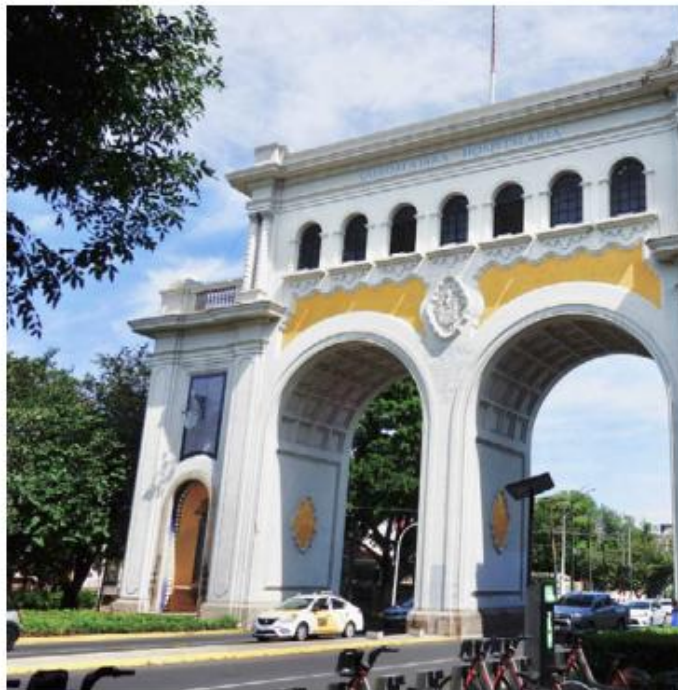
La medida es fruto de una revaloración.