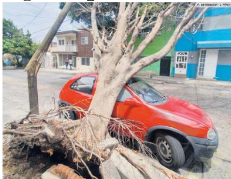
DENUENCIA CIUDADANA. Gracias a los reportes, el Ayuntamiento de Guadalajara ha podido detectar árboles que han caído y luego se los retira. En la imagen, por ejemplo, se encontraba en la Colonia Belisario Domínguez.

Sugerencias, quejas y comentarios 33-3678-8893 comentarios@informador.com.mx