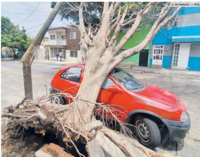
DENUNCIA CIUDADANA. Gracias a los reportes, el Ayuntamiento de Guadalajara ha podido detectar árboles que han caído y luego se les retira. El de la imagen, por ejemplo, se encontraba en la Colonia Belisario Domínguez.

El funcionario tapatío explicó que semanalmente evalúan 700 ejemplares de los más de un millón que hay, y como resultado se ha determinado intervenir 14 mil este año.