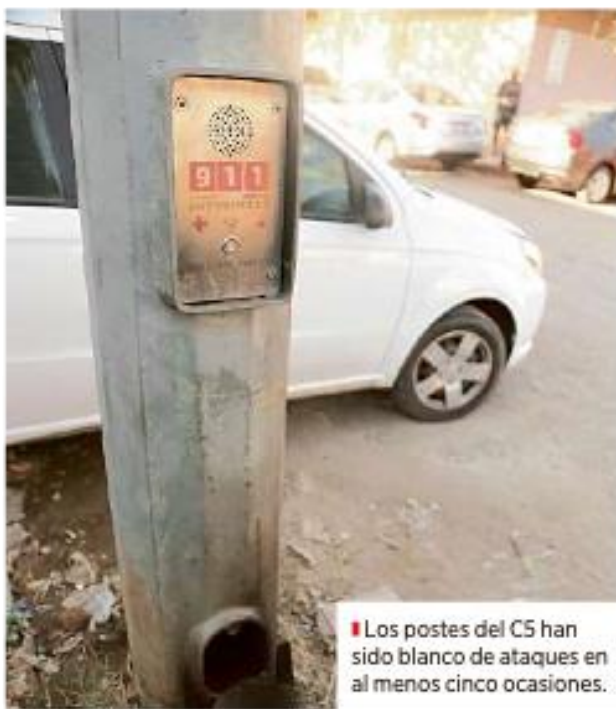
Los postes del C5 han sido blanco de ataques en al menos cinco ocasiones.

En 2019 hubo 841 reportes por situaciones de no