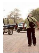
En Tlajomulco fue localizado un cadáver carbonizado.