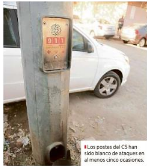
Los postes del C5 han sido blanco de ataques en al menos cinco ocasiones.

En 2019 hubo 841 reportes por situaciones de no