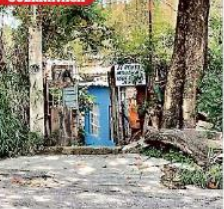
Casas humildes en Chiapas y Morelos fueron registradas como domicilios fiscales de las empresas involucradas en las operaciones ilícitas.