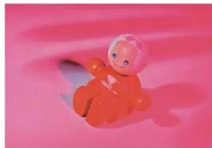
El proyecto Te Protejo México busca que se retire de la red el contenido sexual que involucre a menores de edad.

"Es la primera herramienta virtual en México. Los usuarios pueden hacer su reporte de dos maneras: una es a través de www.teprotejomexico.org o descargando en el celular la App Te Protejo Latino", compartió.