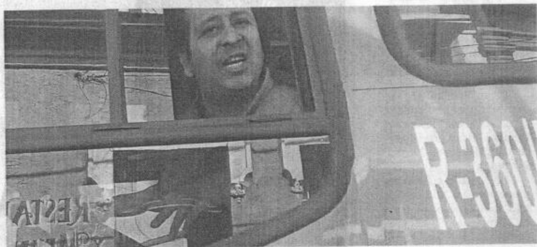
■ El líder sindical que representa al chofer de la Ruta 360 asegura que éste fue provocado.

Justificó la actitud del chofer porque este había sido provocado por el ciclista. Para Li-