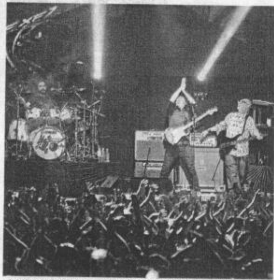
Según el Patronato de las Fiestas de Octubre, el contrato con artistas como Caifanes (foto), se harán públicos a mediados del 2015.

"No tenemos presupuesto del Gobierno del Estado", expresó. "Si yo un patrocinador sabe lo que estoy cobrando a la competencia, no me va a dar más".