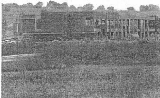
El CUTonalá todavía se encuentra en construcción.

Asimismo, dijo desconocer qué fin han tenido los restantes 133 millones, pues él sólo fue el comisionado de adquirir un