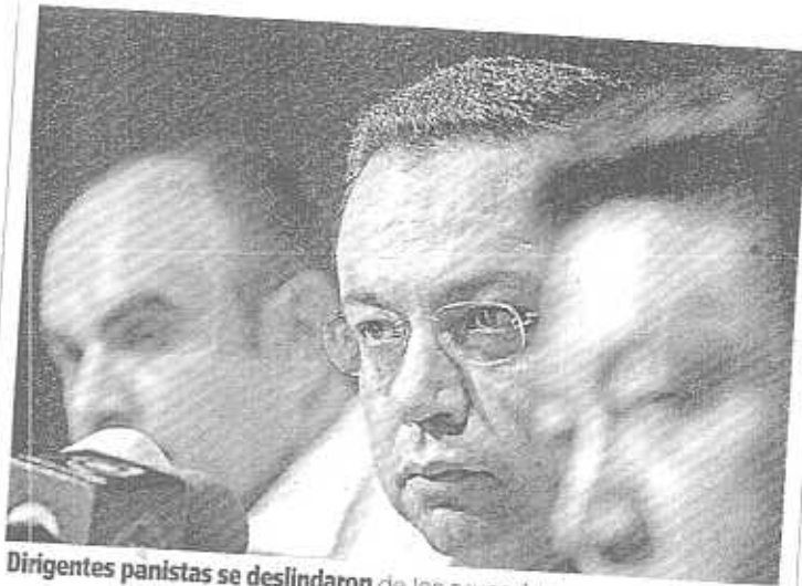
Dirigentes panistas se deslindaron de los acusados