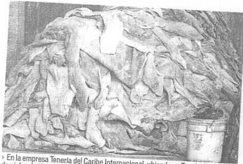
En la empresa Tenería del Caribe Internacional, ubicada en Tonalá, hay restos de pieles de tiburón abandonadas.

ejido, dijo desconocer quién es el propietario del terreno, que se encuentra en la misma situación que la mayoría de la zona, cuyos dueños vendieron.