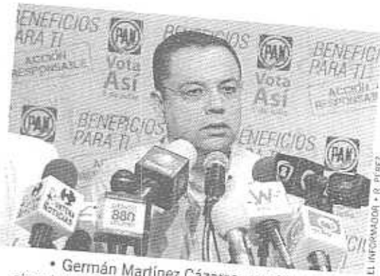
• Germán Martínez Cázares, presidente nacional del Partido Acción Nacional, durante la rueda de prensa ofrecida ayer.