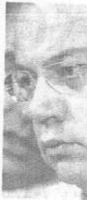
Enrique Peña Gobernador del Edomex

“ Hay que decirle a Peña Nieto que las campañas no son una telenovela con final feliz. Son un momento para que todos descubramos lo que queremos y, el final, lo ponen los ciudadanos en las urnas”.