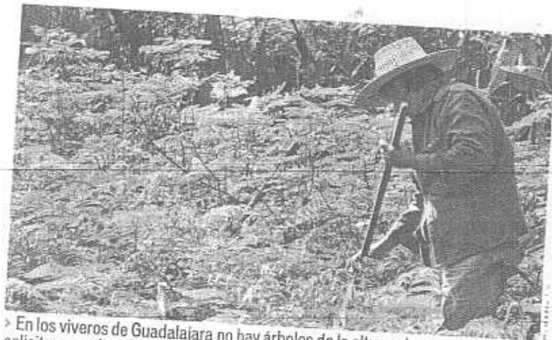
► En los viveros de Guadalajara no hay árboles de la altura y las especies que se solicitan para la reforestación de la Ciudad.