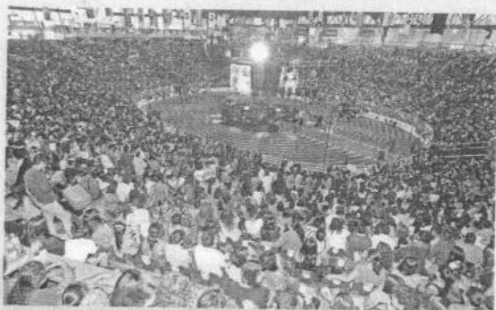
■ De darse a conocer detalles del contrato, se podrían afectar las negociaciones con los cantantes, según el patronato.

"Es información completamente pública y tienen que, insisto, estar publicados en la página web", advirtió.