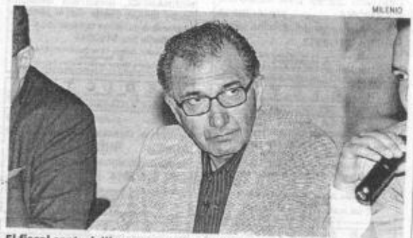
El fiscal central dijo que van 41 denuncias contra el notario 64

"Tenemos documentadas 41 denuncias, de esas 41 hemos consignado nueve, de las cuales tres son por delitos graves y ya les concedieron tres amparos, las otras son por delitos no graves, pero las que se cumplieron el 15 de diciembre son: una por delito grave y otra por delito no