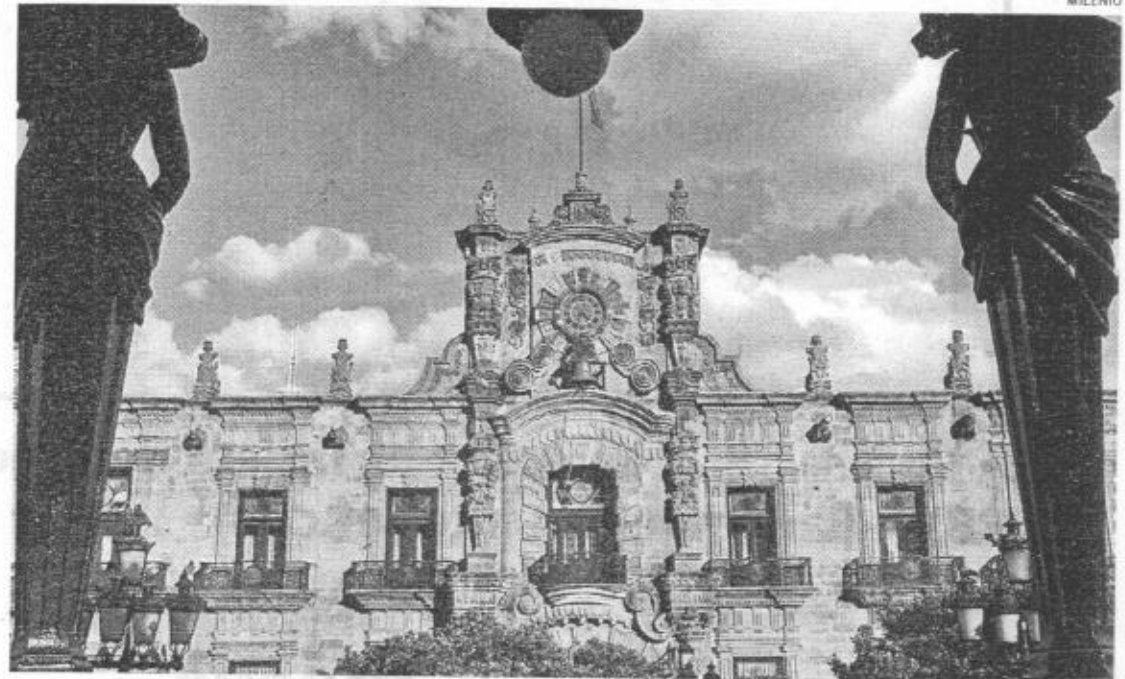
La propuesta para acotar la medida fue planteada por PMC y aceptada directamente por el gobierno estatal