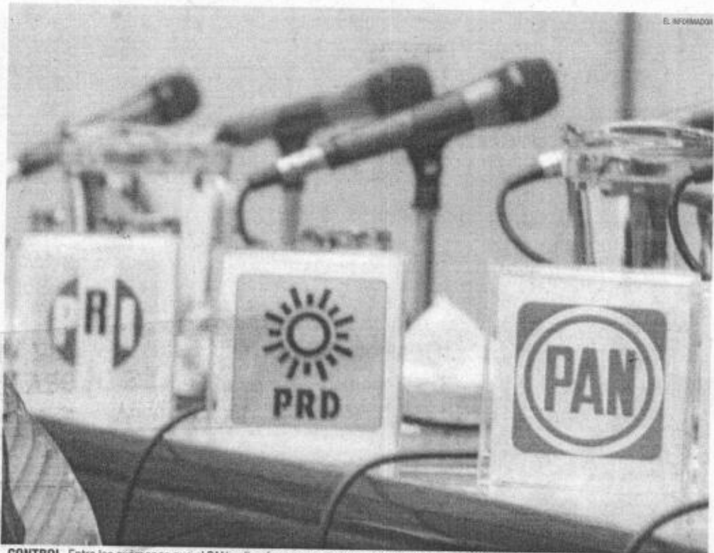
CONTROL. Entre los exámenes que el PAN aplicaría a sus aspirantes, de ser necesario, se encuentra el polígrafo.

El costo de los exámenes podría oscilar los cuatro mil pesos que serán cobrados a los aspirantes.