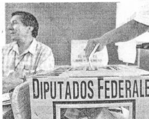
El registro para candidatos a alcaldías y diputados está por iniciar

El delegado del CEN priista informó que los aspirantes deberán firmar una autorización para ser investigados; mientras que el presidente del PAN en Jalisco dijo que aplicarán examen de control de confianza