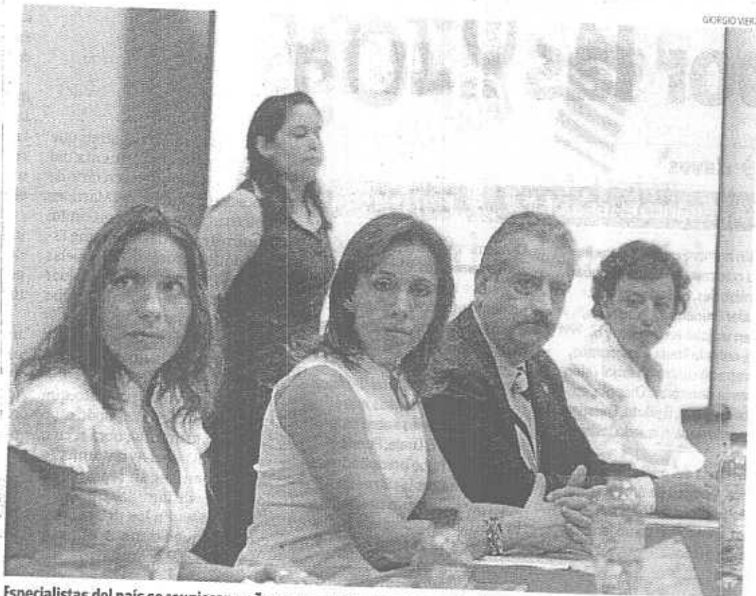
Especialistas del país se reunieron en Zapopan para el foro nacional sobre explotación sexual de menores