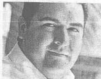
> Modificado de "Color Esperanza"

Las elecciones se acercan y hay algo en Zapopan que empieza a cambiar. Con la esperanza en los ojos Zapopan Unido comienza a soñar. Quiero que Zapopan sea de todos, y que no haya robos nunca más. Quiero que ese día sueltas toda tu energía, porque es tiempo de cambiar. Paso las horas en carro, pensando en el metro que Vielma traerá, con un gobierno distinto que cuida el ambiente de nuestra ciudad. Quiero que haya escuela para todos y que todos puedan trabajar. Quiero que en mi calle vibre toda la energía de nuestra bella ciudad. Voy con Héctor Vielma en Zapopan a ganar. Esta vez unidos, vamos a cambiar. Quiero que Héctor Vielma llegue pronto a gobernar.