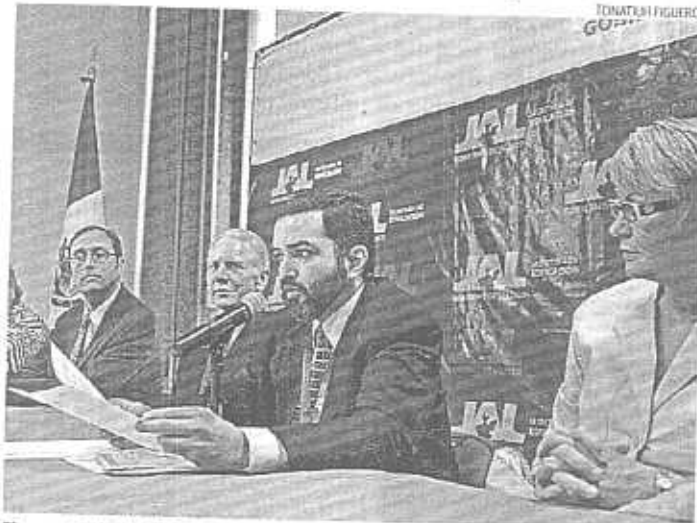
El secretario de Educación recibió a funcionarios de universidades de EU

Ahora, 25 escuelas primarias forman parte del programa piloto Aprendizaje de Primera Lengua Extranjera (APLE), donde se ofrecen clases gratuitas de inglés. Además, en los planteles con Enciclomedia, alumnos de quinto y sexto grado aprenden inglés, a la par que lo hacen los propios maestros.