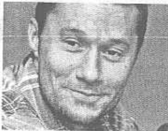
> Original de Diego Torres

Sé que hay en tus ojos con sólo mirar que estás cansado de andar y de andar y caminar girando siempre en un lugar. Sé que las ventanas se pueden abrir, cambiar el aire depende de ti, te ayudará vale la pena una vez más. Saber que se puede, querer que se pueda, quitarse los miedos, sacarlos afuera pintarse la cara color esperanza tentar al futuro con el corazón, Es mejor perderse que nunca embarcar, mejor tentarse a dejar de intentar, aunque ya ves que no es tan fácil empezar. Sé que lo imposible se puede lograr, que la tristeza algún día se irá, y así será la vida cambia y cambiará. Sentirás que el alma vuela por cantar una vez más. Vale más poder brillar que sólo buscar ver el sol.