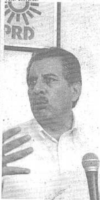
JESÚS Ortega, dirigente nacional del PRD.