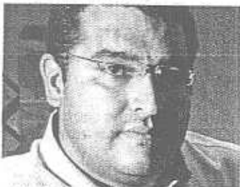
> Versión cambiada

¡Zapopan Unido! ¡Zapopan Unido! ¡Quiero mi ciudad, quiero más trabajo! ¡Mejor transporte y seguridad! ¡Es tiempo de cambiar, no te quedes atrás! ¡Con Héctor Vielma vas a ganar! ¡Zapopan Unido! ¡Zapopan Unido! ¡Por educación, con mejores sueldos, tenemos la ciudad que merecemos! ¡Él va trabajar sin descansar, por el futuro y tu bienestar! ¡Zapopan Unido! ¡Zapopan Unido! ¡Hay que innovar, generar el cambio! ¡Un gobierno nuevo es necesario! ¡Él ama su ciudad, quiere verla limpia y de tu familia él cuidará! ¡Zapopan Unido! ¡Zapopan Unido! ¡Zapopan Unido!