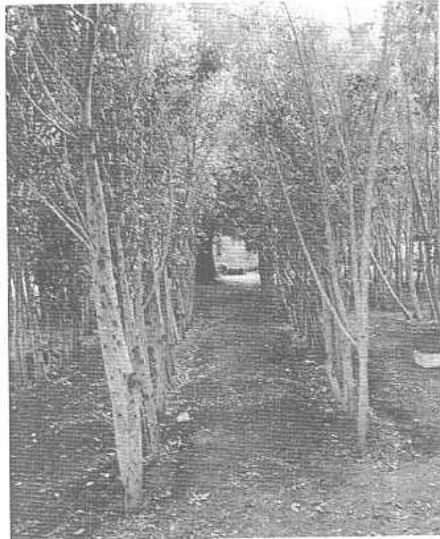
EL INFORMADOR • G. FERRAS

"Que se cancele la licitación, que los propios viveros del Ayuntamiento sean los que surtan de árboles. Guadalajara no tiene la capacidad de estar gastando 20 mil pesos por árbol. Nosotros vamos a intentar trabajarla hoy (la iniciativa), para mañana cuando menos hacerlo público en la sesión de cabildo".