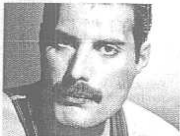
> Original de Queen

We will we will rock you! We will we will rock you! Buddy you're a young man hard man Shoutin' in the street gonna take on the world some day You got blood on yo' face You big disgrace Wavin' your bannner all over the place Singin' We will we will rock you! We will we will rock you! Buddy you're an old man poor man Pleadin with your eyes gonna make you some peace some day You got mud on your face You big disgrace Somebody gonna put you back in your place We will we will rock you We will we will rock you