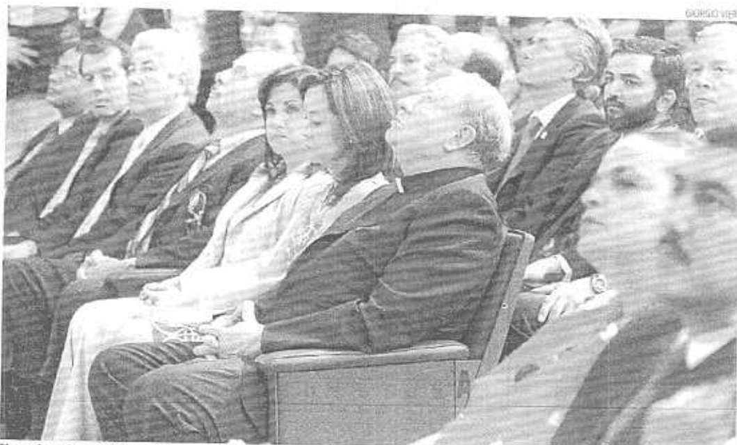
El cardenal prefirió preocuparse por los asuntos del cielo: pese a las críticas, dijo, “estoy muy tranquilo”

En un tenor más o menos similar se manifestó el gobernador Emilio González Márquez, quien