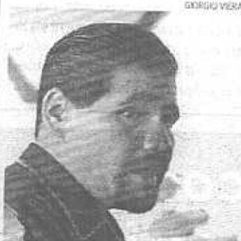
Así lucía en 2007