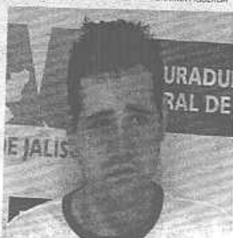
Ayer, tras ser detenido

El ex secretario general del Ayuntamiento de Tonalá fue trasladado ayer a Puente Grande, donde se le seguirá el proceso penal