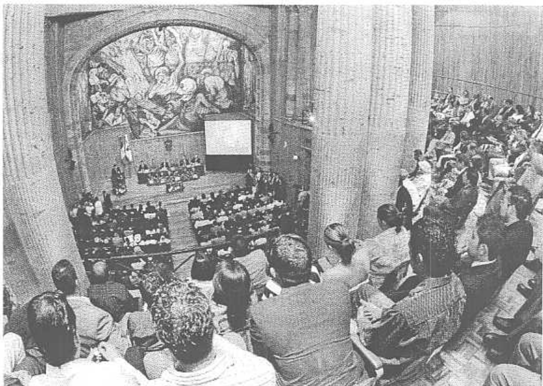
DESDE GAYOLA. Algunos consejeros universitarios tuvieron que escuchar y observar al Rector desde arriba del Paraninfo, pues los asientos en la parte baja se reservaron para los invitados especiales.