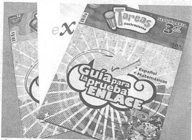
► Las guías que están a la venta en puestos de periódicos e incluso en librerías, no están avaladas por la Secretaría de Educación.

La editorial Auroch tiene a la venta un libro a 60 pesos que es ofrecido a padres de familia para que ayuden a sus hijos a revisar los contenidos que probablemente verán en la prueba y a que conozcan el formato del examen.