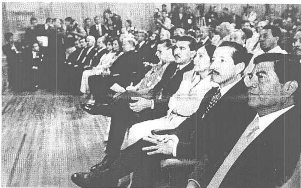
EN PRIMERA FILA. El Gobernador de Puebla, Mario Marín (der. a izq.); de Nayarit, Ney González; de Zacatecas, Amalia García; Silverio Cavazos, de Colima y la presidenta nacional del PRI, Beatriz Paredes.