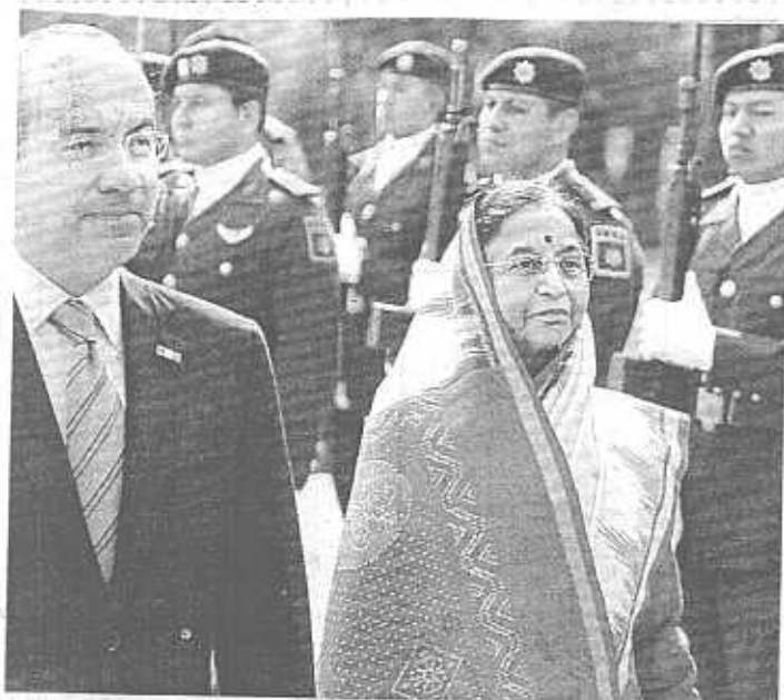
Felipe Calderón recibió con honores de Estado a Pratibha Patil

La Presidencia refirió, en un comunicado, que en el encuentro dialogaron sobre “los retos de las naciones latinoamericanas, entre los cuales se cuenta la necesidad de acelerar un desarrollo económico integral de la región con justicia”. ■ P