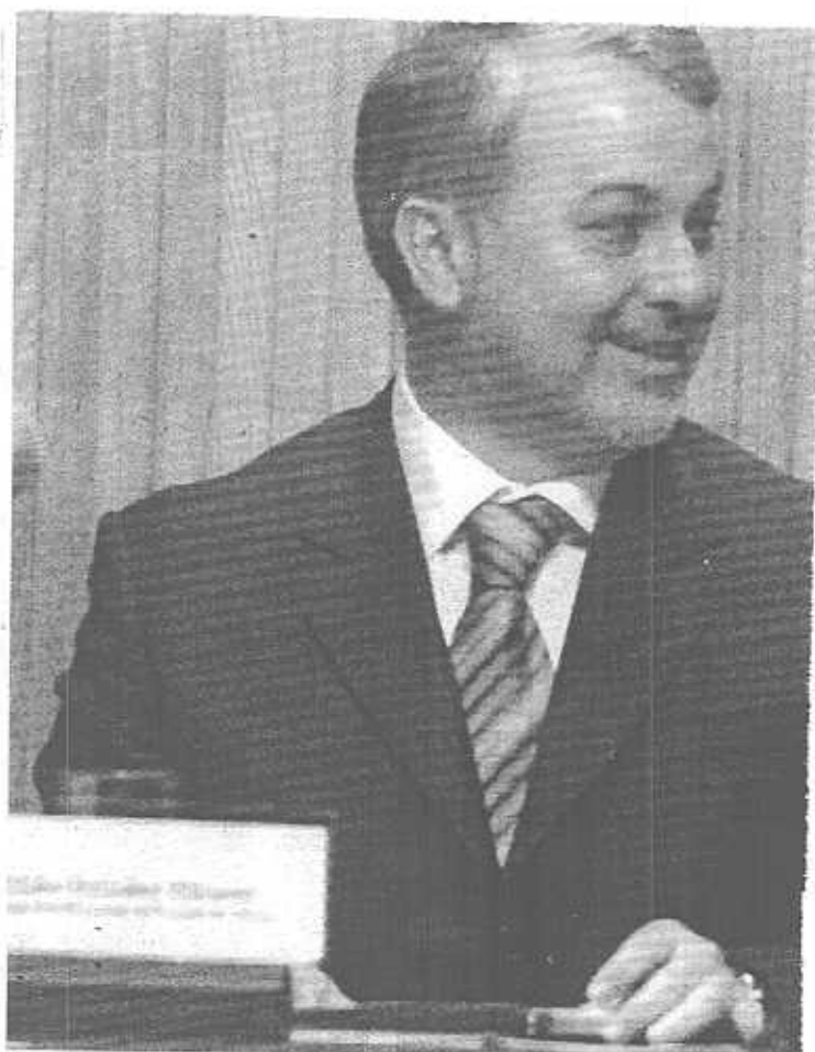
La amable relación entre el gobernador (izq) y el rector quedó más clara