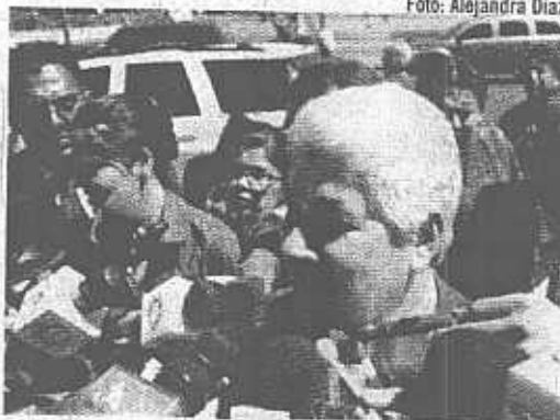
FRANCISCO Ramírez Acuña.

El ex gobernador y ex secretario de Gobernación Francisco Ramírez Acuña, negó haberse destapado como aspirante a la Presidencia de la República durante un encuentro con ex alcaldes; por el contrario, dijo que se convertirá en empresario y que para pensar en ir por «la grande», falta mucho.