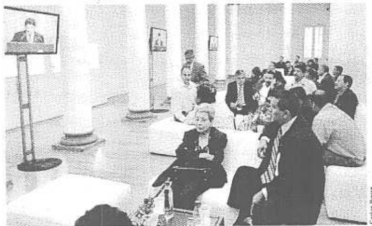
LOS QUE NO CUPieron. A los consejeros y otros invitados que no alcanzaron lugar en el Paraninfo, les habilitaron sillas, pantallas y sonido en los patios de Rectoría y en salas del Museo de las Artes.