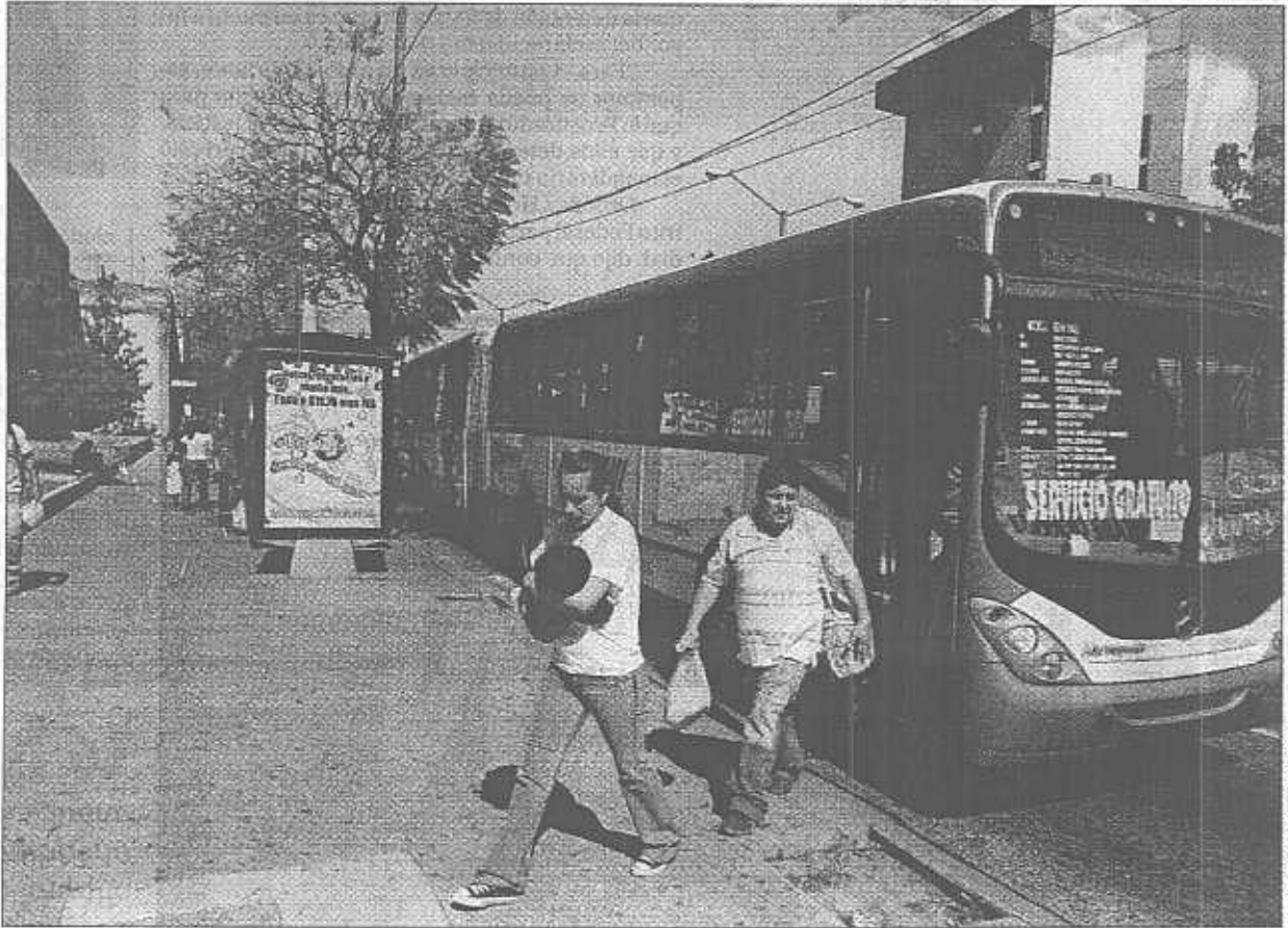
EL INFORMADOR • A. CAMACHO

• El Macrobús será una ruta alimentadora del Sistema del Tren Eléctrico Urbano. La primera línea circulará por la Calzada Independencia.