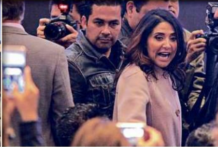
■ Alejandra Barrales, quien buscará la jefatura del GCDMX.