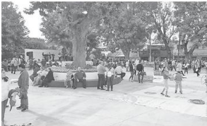
La plazoleta de la Unidad Habitacional Clemente Orozco luce reparaciones

Alcalde presenta la nueva cara del mercado de la UCO, y de la Unidad Habitacional 6