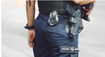
OPINIÓN. Los encuestados no tienen confianza en las corporaciones.

sulta es que 46.1 por ciento no tiene confianza en los uniformados, mientras que apenas 5.4 por ciento contestó que los elementos de seguridad les inspiran mucha confianza. De las colonias revisadas, en Oblatos es donde hay una