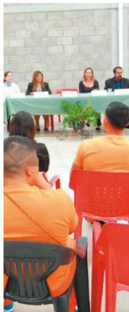
SE BUSCA reducir las barreras sociales y promover experiencias de aprendizaje para los estudiantes privados de su libertad.

El programa se imparte también en el Centro de Reinserción Femenil desde hace un año y que ésta es a primera ocasión que se ofrece a manera de un diplomado en un centro varonil. El diplomado tiene un valor curricular de 90 horas, se basa en el modelo del Inside-Out Prison Exchange Program, combinando la educación formal con una experiencia de intercambio sociopedagógico entre estudiantes universitarios e internos del sistema penitenciario, donde se busca reducir las barreras sociales y promover experiencias de aprendizaje para los estudiantes privados de su libertad, como para los externos.