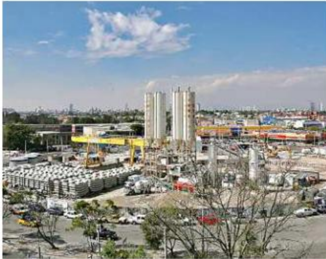
Los nuevos Planes Parciales están enfocados en la redensificación, en zonas con transporte público, como la L3 (foto).

Estas agrupaciones rechazan la política de redensificación por considerar que se entrega a la Ciudad a la es-