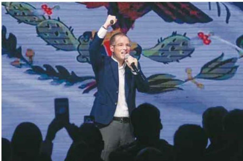
Ricardo Anaya se reunió con sus simpatizantes ayer en el World Trade Center de la Ciudad de México.

Aunque era un secreto a voces, Ricardo Anaya se destapó como precandidato a la Presidencia del país, por la coalición Por México al Frente. En tanto, Margarita Zavala criticó el “auto dedazo” de Anaya calificándolo como una práctica del pasado, y dice que “es no tener vergüenza”. Pide el voto para hacer oposición al PAN