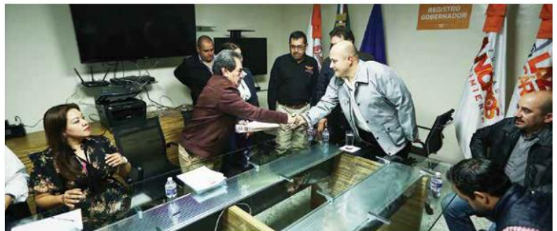
“Estoy orgulloso de ser el primer gobierno de Guadalajara que se sometió a una Ratificación de Mandato, lo hicimos como un acto de congruencia y lo haremos en cada responsabilidad pública”, precisó Enrique Alfaro.

aquí estamos construyendo una fuerza electoral que puede definir el resultado de la elección presidencial, actuemos con conciencia de ello porque en función de eso o a partir del tamaño de la importancia que Jalisco tiene en la elección nacional, es también el tamaño de los ataques y de la andanada que se viene en contra de nosotros.