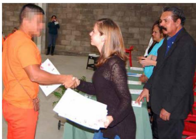
TERMINA. Uno de los reclusos recibe el certificado de manos de autoridades.

diplomado en un centro varonil. El programa, añadió, pretende ser incluyente al estar diseñado para que alumnos de la universidad puedan interactuar en un salón de clases con personas privadas de la libertad.