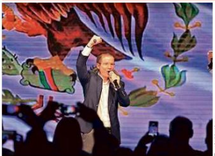
Ricardo Anaya proyectó fotos que fueron abucheadas: las de Carlos Romero Deschamps y Elba Esther Gordillo.