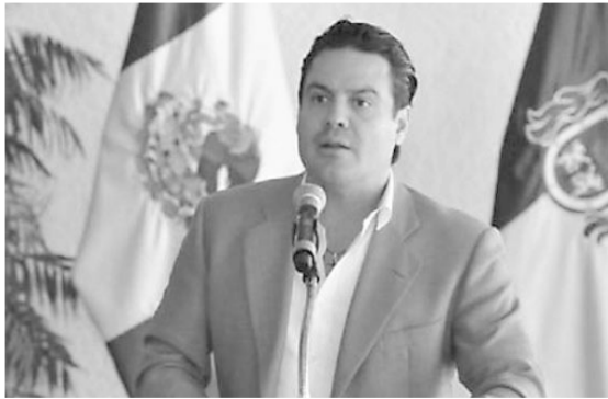
ARISTÓTELES no es el que más se llevará esta Navidad.