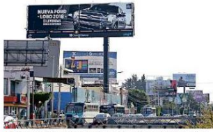
En la zona de La Minerva, que es hito urbano, hay pantallas electrónicas. La de L. Mateos entre A. Aceves y La Paz es doble.