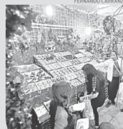
Se instalarán 17 tianguis

Este año se instalaron 17 tianguis navideños en diferentes colonias y seis ferias navideñas. M