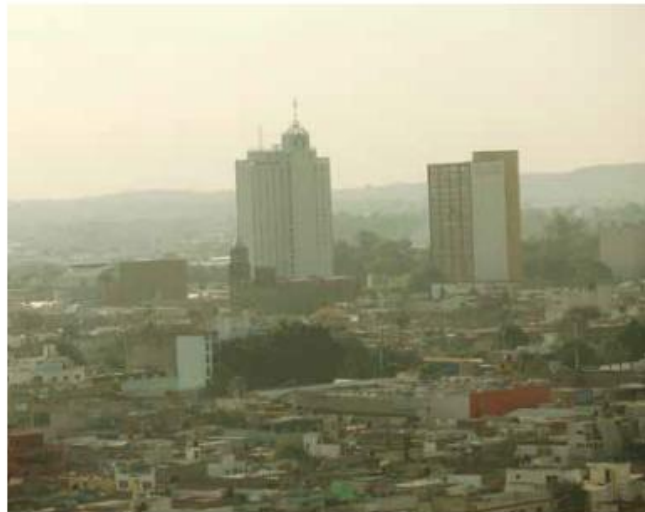
ALERTA. El sistema de monitoreo se encarga de dar a conocer eventos contaminantes.

“La Semadet lo que presenta en el sistema de información en el tema de monitoreo y calidad del aire es no solamente de alto nivel de confiabilidad, es un sistema