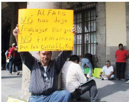
Los calandrieros endurecen las protestas y el pasado lunes 4 de diciembre tres miembros de la Asociación de Calandrieros de Guadalajara iniciaron una huelga de hambre a las puertas del palacio municipal.

De ahí que lanzó un llamado urgiendo a la solidaridad de la ciudadanía no solo con sus tres compañeros que están en huelga de hambre sino en favor de los casi 60 calan-