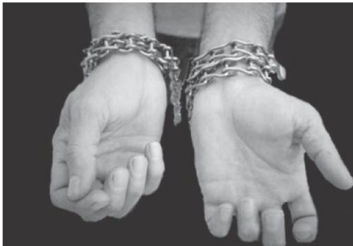
QUEJAS. El año pasado los OPDH recibieron 217 mil 768 quejas por presuntas violaciones, el 30% fueron aceptadas y un 37% a orientación

"Los Derechos Humanos no son un bonito discurso, una carta de buenas in-