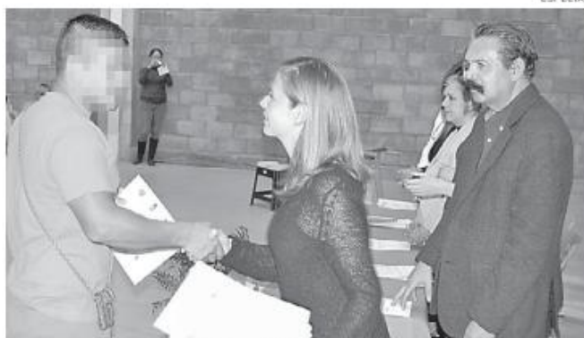
Reciben certificado en diplomado impartido por la UPN

Cabe señalar que este programa se imparte también en el Centro de Reinserción Femenil desde hace un año y que esta es la primera ocasión que se ofrece a manera de un diplomado en un centro varonil, pues el programa, busca ser incluyente al estar diseñado