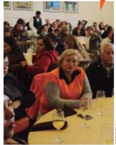
CELEBRAN. La semana pasada se conmemoró el Día Internacional de los Voluntarios.