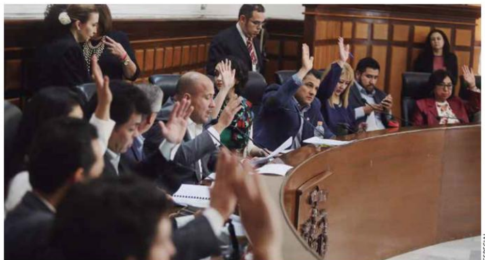
SESIÓN. Hoy se pondrá el tema sobre la mesa en el pleno.

Entre otros señalamientos, apuntan que “el rechazo es por el ilegal despojo de predios de pro-