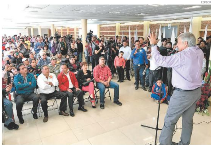
“Posiblemente soy el más atacado en el país, ya estoy acostumbrado a eso”, expresó el tabasqueño.

AMLO ironizó al decir: “Lo que voy a hacer es pedirle a esos que