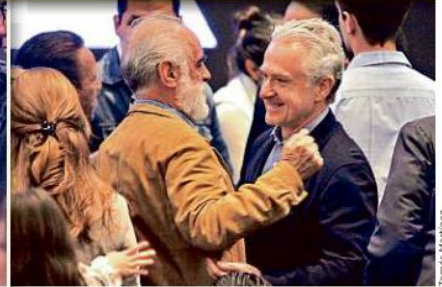
■ Diego Fernández de Cevallos y Santiago Creel.