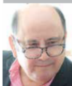
Por | Gabriel Ibarra Bourjac