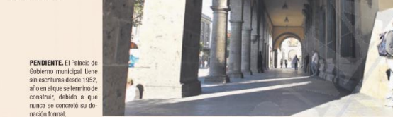
PENDIENTE. El Palacio de Gobierno municipal tiene sin escrituras desde 1952, año en el que se terminó de construir, debido a que nunca se concretó su donación formal.