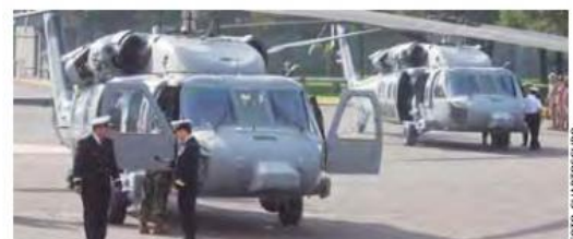
La Iniciativa Mérida incluyó en septiembre del 2011 el donativo de tres helicópteros Black Hawk tipo UH-60M de parte del gobierno norteamericano.