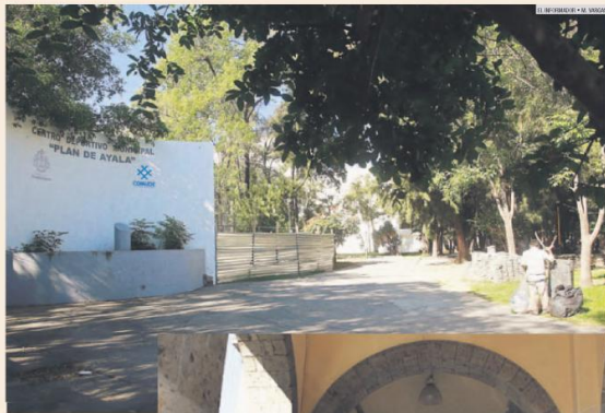
EN PROCESO. La Unidad Deportiva "Plan de Ayala", también conocida como Parque San Rafael, es uno de los predios de los que se espera la donación formal por parte del Gobierno del Estado.