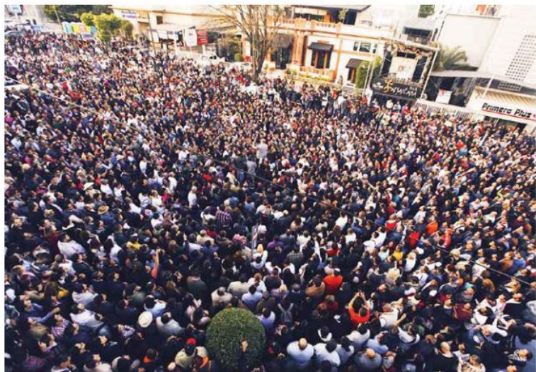
Miles de militantes y simpatizantes del Partido Movimiento Ciudadano se concentraron la tarde del pasado sábado frente a las oficinas de este instituto político en Av. La Paz para acompañar al registro de su abanderado al Gobierno del Estado, Enrique Alfaro Ramírez.

to, no podemos obsesionarnos con una sola cosa, nuestros actores desde que iniciamos el proceso de construcción están convencidos que no nada más en una trincheras se puede aportar, hay más trincheras, creemos que nos irá bien en la elección de candidato a gobernador, serán muchos municipios los que darán la sorpresa en 2018, hay salidas y espacios que tenemos que construir, hablando con la verdad, las