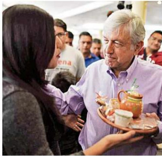
De gira por el Edomex, el tabasqueño criticó que tanto Meade como Anaya no salgan a recorrer los pueblos del País.

López Obrador vaticinó que, en las semanas previas a la elección, sus contrincantes se unirán en su contra.