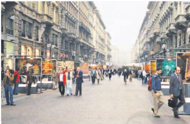
DINÁMICA. En Italia, para resguardar la seguridad del peatón y proteger los monumentos se hicieron corredores sin automóviles.

La Avenida 16 de Septiembre-Alcalde fue absorbida por esta tendencia al servir en los últimos años principalmente como una ruta de Norte a Sur. Pero la gran cantidad de tránsito terminó por afectar