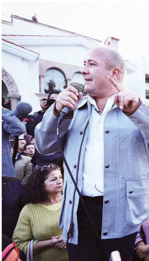
Por segunda ocasión Enrique Alfaro buscará la gubernatura de Jalisco. A nivel federal pide a sus seguidores apoyar al Frente, pero va sin Frente a nivel local.

ENRIQUE ALFARO/ PRECANDIDATO DE MOVIMIENTO CIUDADANO AL GOBIERNO DE JALISCO