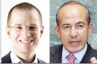
RICARDO ANAYA / VIRTUAL CANDIDATO PRESIDENCIAL

“ El PAN, que era el partido democrático por naturaleza, cancela internas; su dirigente abusa del poder y se autoproclama candidato. 2 partidos más le sirven de tapete. Y todavía hay cinismo de llamarle 'día histórico para la democracia'. Chale”.