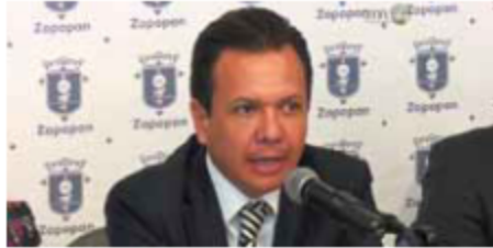
PABLO Lemus busca la reelección.