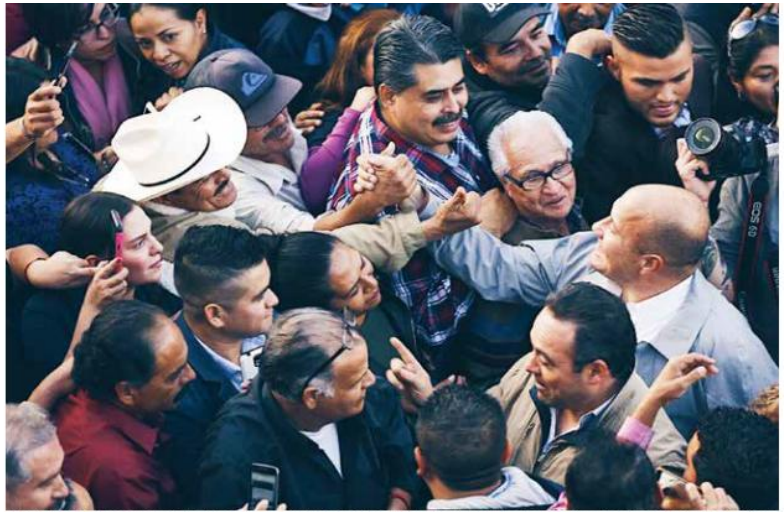
“No queremos vallas y cercos de protección, no queremos juegos artificiales en nuestros eventos, nosotros necesitamos nada más un lugar donde levantar la voz”, expresó el abanderado del Partido Movimiento Ciudadano.

ENRIQUE ALFARO/ PRECANDIDATO DE MOVIMIENTO CIUDADANO AL GOBIERNO DE JALISCO