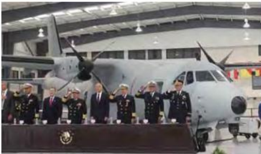
En diciembre del 2011, México recibió un avión CASA 235 Persuader y tres vehículos Backscatter de inspección no invasiva a través de la Iniciativa Mérida.

Las tres entregas de equipamiento que se han dado en estos años con la Iniciativa han tenido tres objetivos principales: el desmantelamiento de la-