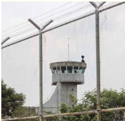
EDUCACIÓN. La generación de este diplomado es la primera en el penal de Puente Grande.

Destacó que este programa se imparte también en el Centro de Reinserción Femenil desde hace un año y esta es la primera ocasión que se ofrece a manera de un