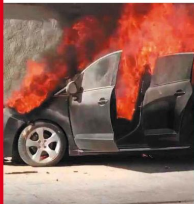
Una supuesta falla mecánica en el motor causó que un vehículo tipo Peugeot se incendiara la mañana de este domingo al ir circulando por la avenida Acueducto. Al ser consumido por el fuego, el automovilista se orilló debido a la dimensión de las llamas, luego llegaron Bomberos de Zapopan, los cuales auxiliaron en el sofocamiento. El conductor iba solo, sin embargo no resultó herido.