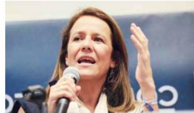
MARGARITA ZAVALA/ ASPIRANTE INDEPENDIENTE A LA PRESIDENCIA

“ ¿#PorMéxicoAlFrente? Más bien #DeEspaldasALosCiudadanos.