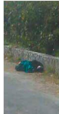
EL INFORTUNADO tenía signos de que fue golpeado y torturado.

El infortunado tenía signos de que fue golpeado y torturado. Por ello personal de la Fiscalía Regional tomó conocimiento de lo acontecido. El área permaneció cerrada por un tiempo más, para que los peritos realizaran el levantamiento de los indicios. En tanto que el cuerpo fue remitido a la morgue sin ser identificado.