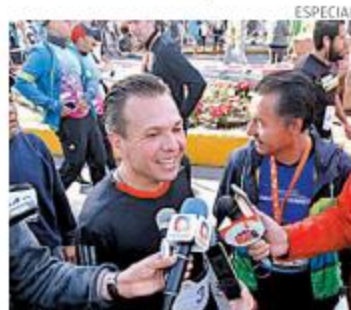
Ayer participó en una carrera

“La gente está cansada del dispendio, de muchos partidos y de muchos candidatos, en mi compañía no verán espectaculares, no van a ver grandes anuncios, folletos, absolutamente nada, nosotros vamos a ver una campaña austera, una campaña en la calle, tocando puertas, caminando en la calle, estando cerca de la gente”, señaló el munícipe. M