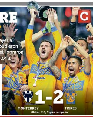
MONTERREY 1-2 TIGRES Global: 2-3, Tigres campeón

Los Tigres dominaron ayer a unos Rayados que no pudieron concretar más goles; así, lograron su sexto título en la historia.