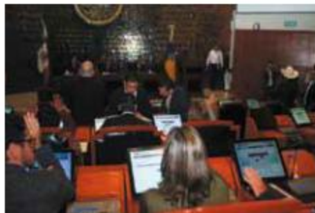
FOMARÁN importantes decisiones mañana.

Para auditor superior del estado de 22 inscritos, en tres casos no se presentaron a la evaluación técnica; para los tres magistrados de la Sala Superior de 72 registrados, 10 aspirantes faltaron; de los 18 para la Fiscalía Anticorrupción cuatro no quisieron presentarse; para los titulares de los órganos de Control, sí asistieron los 16 aspirantes y también los siete que se registraron para contralor del Secretariado Ejecutivo del Sistema Estatal Anticorrupción.