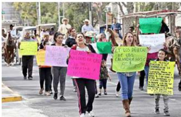
De acuerdo con los manifestantes, unos 60 calandrieros no han podido trabajar por la falta de permiso municipal.