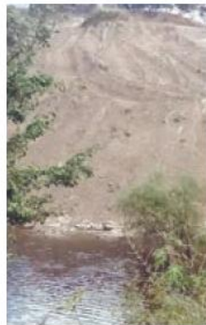
Denuncian omisión municipal

Señalan que incluso ha cerrado calles donde se han encontrado con maquinaria debido al temor de padecer inundaciones.