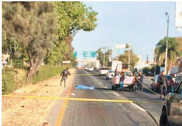
QUEDÓ sobre la carretera a Chapala, sobre el kilómetro 13 en la colonia San Lorenzo, en el municipio de El Salto.

El cuartel presentaba lesiones de regulares a leves. El Ministerio Público de ese lugar tomó conocimiento de lo ocurrido.