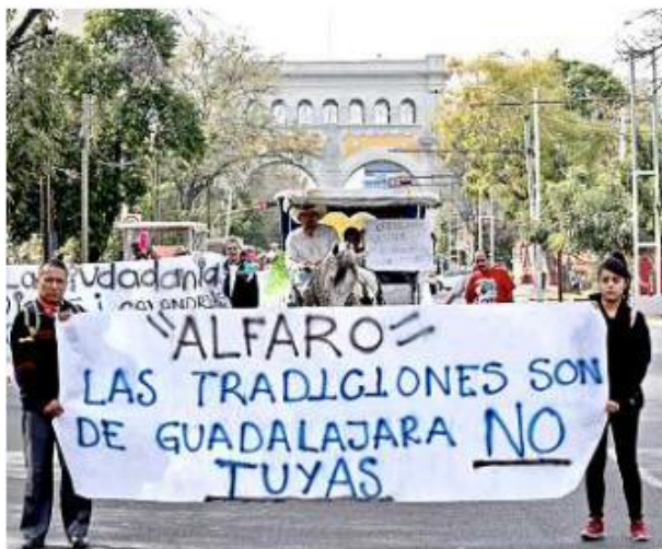
Los inconformes consideran a este transporte como una tradición, que se perdería al ingresar el modelo eléctrico.