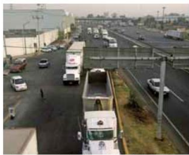
Según datos de autoridades federales, es en Jalisco donde más vehículos de carga robados se localizan; en el primer trimestre de 2017, 16% de las recuperaciones de unidades fueron en la entidad.

La ubicación de la Zona Metropolitana es un factor clave en el incremento de robos, pues está a la mitad de un corredor logístico que ayuda a conectar el transporte de mercancías de la Ciudad de México hacia el Pacífico y es el paso obligado para las mercancías que van rumbo a Manzanillo.