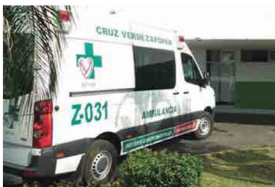
DECESO. Aunque fue atendido por paramédicos de Zapopan, un hombre al que intentaron degollar en La Higuera finalmente murió.

Posteriormente, en Tlajomulco, la comisaría localizó el cuerpo de un hombre envuelto en cobijas dentro del coto Del Sol. El cuerpo de la víctima, de entre 25 y 30 años, tenía huellas de violencia; fue hallado en la calle Real del Sol, a la orilla de un canal dentro del coto, cercano a la avenida Jesús