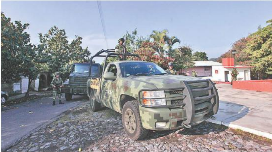
Cuestiona la intervención de las fuerzas armadas de forma permanente en la vida del país