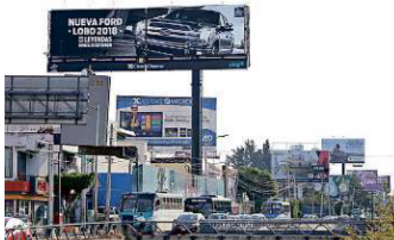
En la zona de La Minerva, que es hito urbano, hay pantallas electrónicas. La de L. Mateos entre A. Aceves y La Paz es doble.

de las empresas, cancelación de créditos fiscales, así como en contra de 17 órdenes de visita y clausuras.