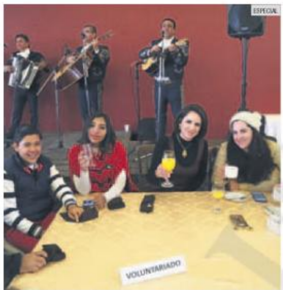
APOYO. Otorgan alimentos y compañía a los pacientes.

Con mariachi, festejaron a 204 grupos de voluntarios que trabajan los 365 días del año para beneficiar a pacientes y familias del Antiguo Hospital Civil de Guadalajara "Fray Antonio Alcalde" y del Nuevo Hospital Civil de Guadalajara "Dr. Juan I. Menchaca".