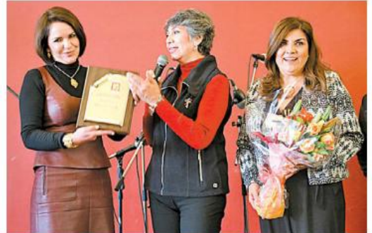
Agradecen a las personas que brindan su apoyo

voluntarios y presidente de la Fundación Voluntarios contra el Cáncer, comentó: "La aportación es muchísima, la verdad es que no se podría concebir el Hospital Civil de Guadalajara sin este apoyo que dan estos grupos voluntarios, son 204 grupos, 160 exclusivamente del tema de alimentos, que dan alimento los 365 días del año, dan alimentos a los familiares de los pacientes que acompañan a los pacientes, realmente es una labor increíble la que hacen, los otros grupos son de acompañamiento van y complementan las labores existenciales".