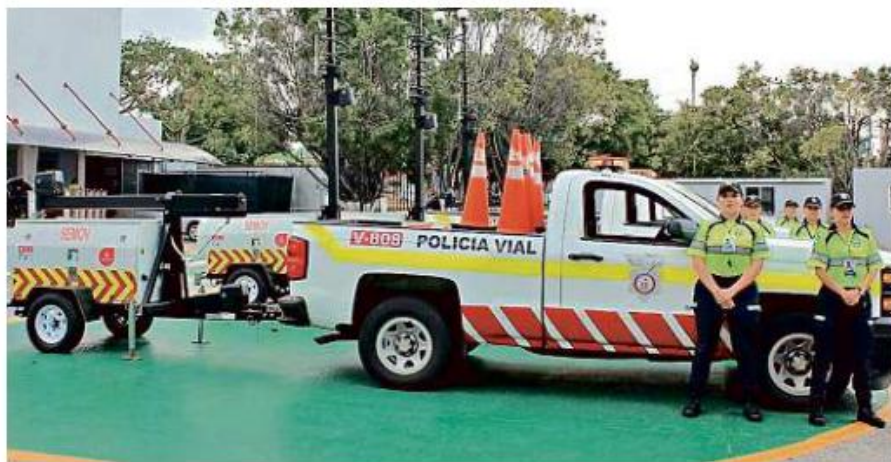
Las policías viales comenzaron a vigilar las calles desde 2014.

Un año después, la cantidad bajó a 310 con 100 procedimientos abiertos -97 hombres y 3 mujeres- que derivaron en el cese de dos elementos masculinos.