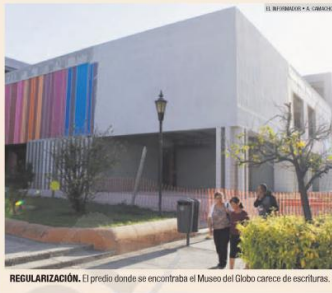
REGULARIZACIÓN. El predio donde se encontraba el Museo del Globo carece de escrituras.