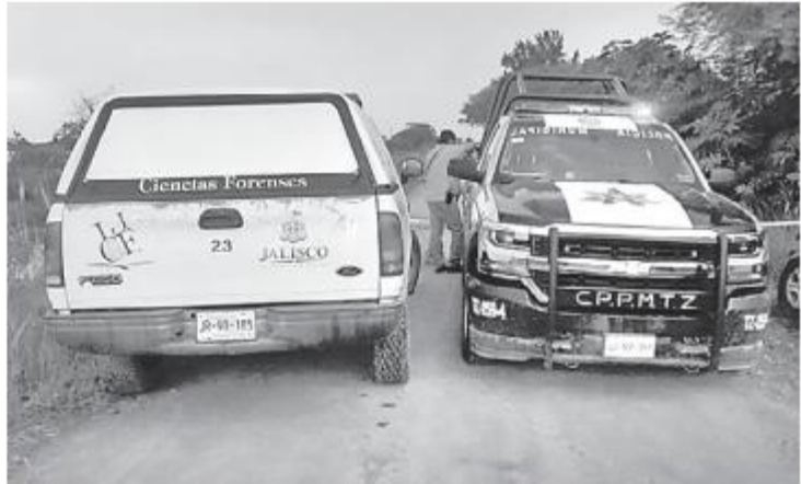
Los hechos se registraron en el transcurso de la mañana

El cadáver fue trasladado a la morgue en espera de que sus familiares lo identifiquen y reclamen sus restos.