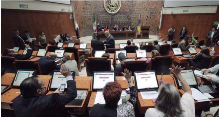
DICEN ES POCO. En el proyecto de gasto 2018, que se discute aún en el Congreso del Estado, se planea otorgar 21 mil 675 pesos a cada integrante del Comité de Participación Social.