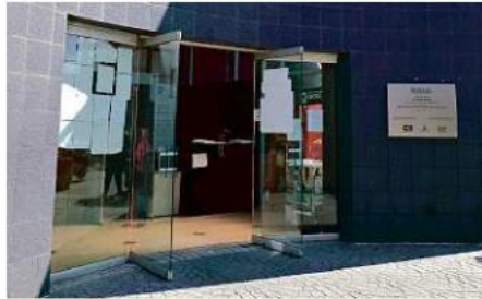
La pareja denunció el abuso en Ciudad Niñez (foto), pero acusan que su hija fue engañada y remitida a un albergue.