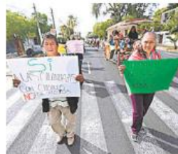
Exigen acciones de autoridades

Con carteles en mano y un micrófono que era tomado por los manifestantes, a paso lento avanzaron hacia el primer cuadro del centro tapatío para llegar al palacio municipal, y pedir el rescate de