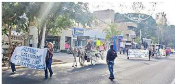
La manifestación de calandrieros avanzó desde los Arcos de Guadalajara hacia el Centro de Guadalajara sobre Av. Vallarta.