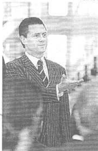
El mandatario mexiquense

"Se debe ir por una reforma hacendaria de mayor alcance, que