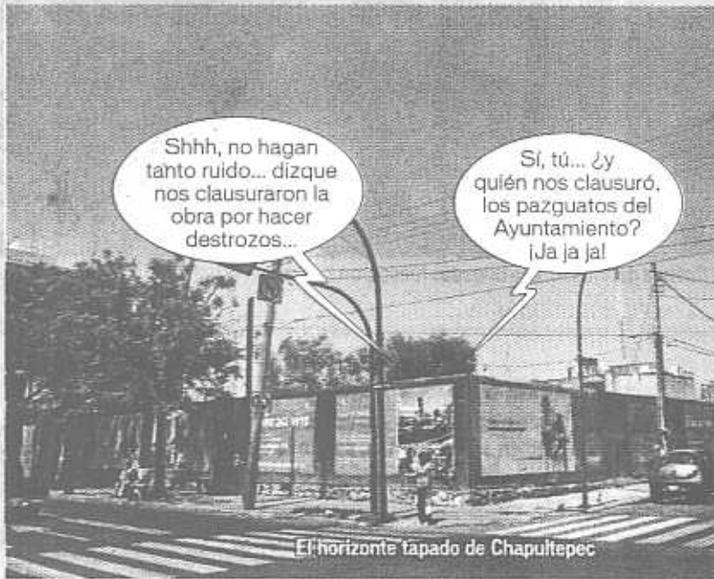
El horizonte tapado de Chapultepec