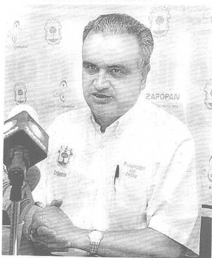
El servidor rechazó que las influencias en el municipio lo favorezcan