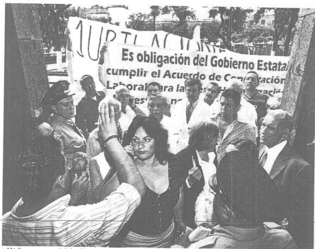
► Médicos y personal de los Hospitales Civiles de Guadalajara acudieron ayer al Congreso del Estado.