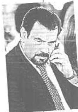
Pie de foto pie de foto