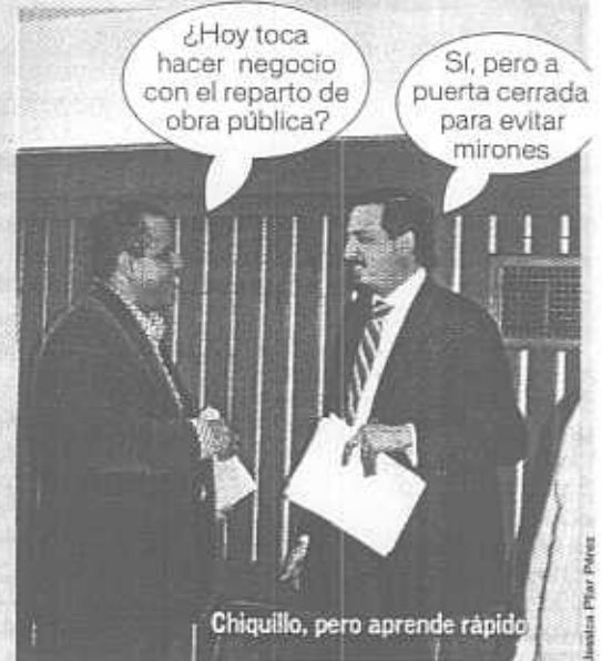
Chiquillo, pero aprende rápido